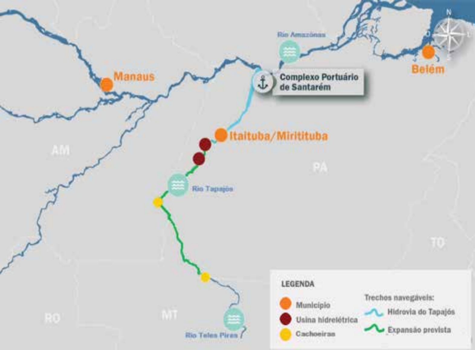
Figura 2 – Hidrovia Tapajós-Teles Pires (Fonte: BRASIL, 2017, p. 43 – adaptado pelo autor).

Apesar das constantes denúncias e ações da justiça intermediando o conflito, inclusive com suspensão de instalações portuárias planejadas por empresas da agrologística, os impulsos construtivos e liberalizantes da regulação portuária não cessam no município. Desde 2013, “pelo menos 10 portos industriais, ligados ao agronegócio, foram construídos ao redor da cidade de Itaituba” e, ainda, “as autoridades locais dizem que mais de duas dúzias de outros portos estão planejados na cidade, pelo menos cinco deles para gigantes das commodities ” (ANDREONI, 2020, s/n).