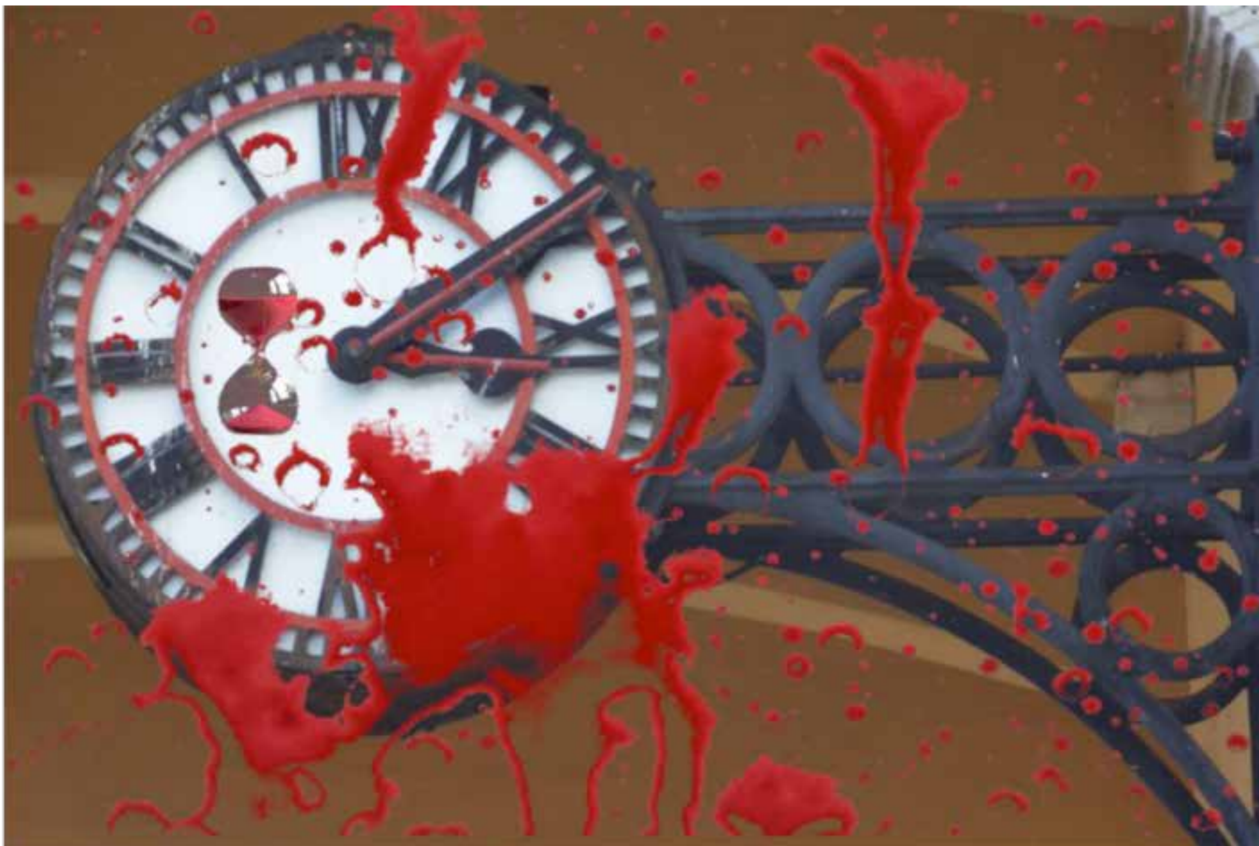
Figura 5 – O tempo não para. Fotomontagem.