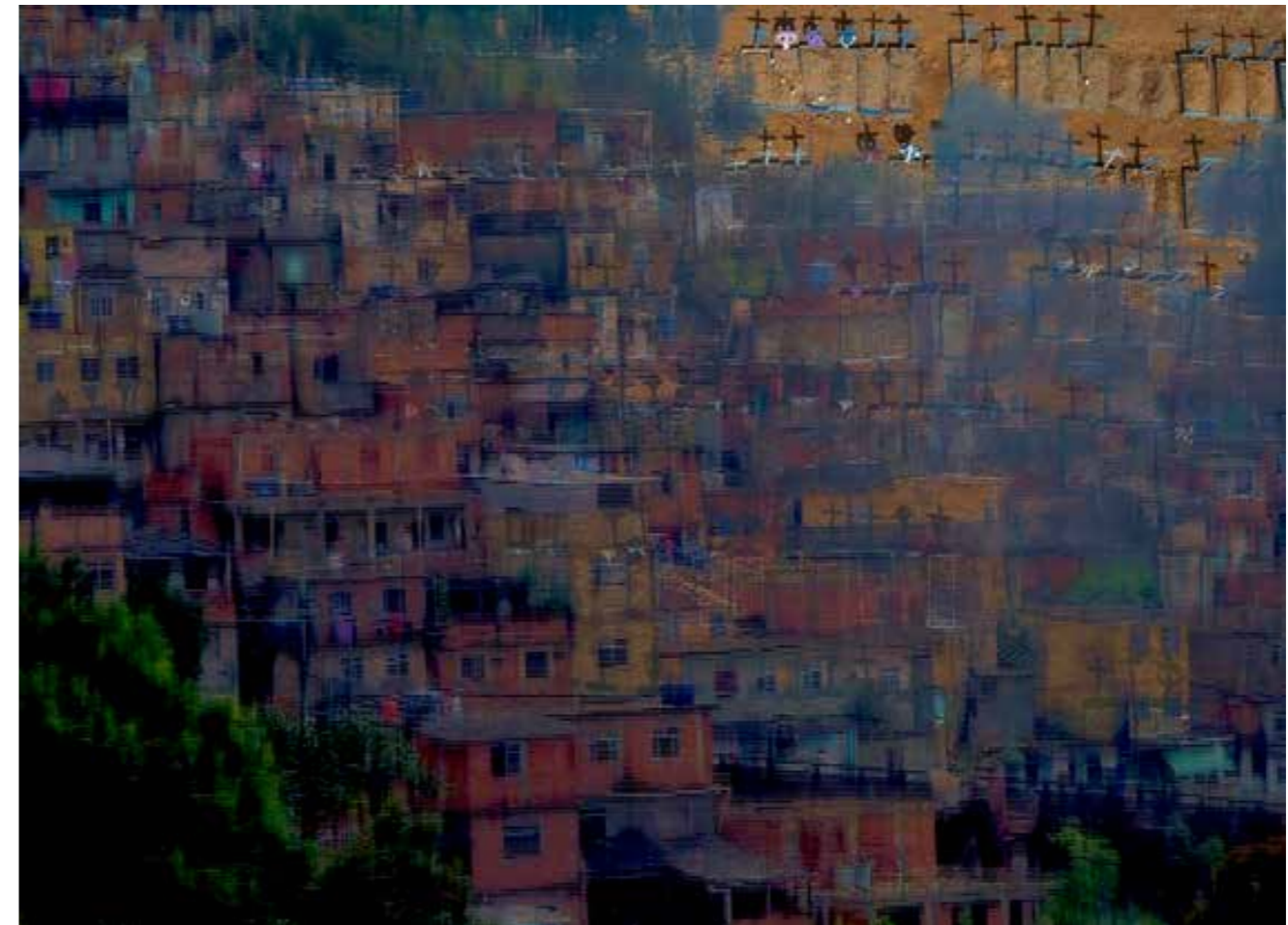
Figura 1 – Moradas. Fotomontagem.

Arte que marca a potência de força na erupção de efeitos que uma imagem pode provocar. Pandemonius nasce e se sustenta sob a referência da pós-fotografia, ousando no sentido de insistir no quanto uma imagem é capaz de afetar mais do que necessariamente significar. A imagem corre no sentido de índice, quebrando signos dados a priori. Pandemonius afeta, enquanto se cria e quando transborda num devir imagético. Traz rastros sem nome. Tateia no escuro de dentro o que a palavra não disse. Traduz para o olho que vê a possibilidade do discurso calado. Através desse experienciar 2 , o olho revela, liberta e compartilha a possibilidade de fazer palavra onde o silêncio habita. A imagem toma efeito de grito.