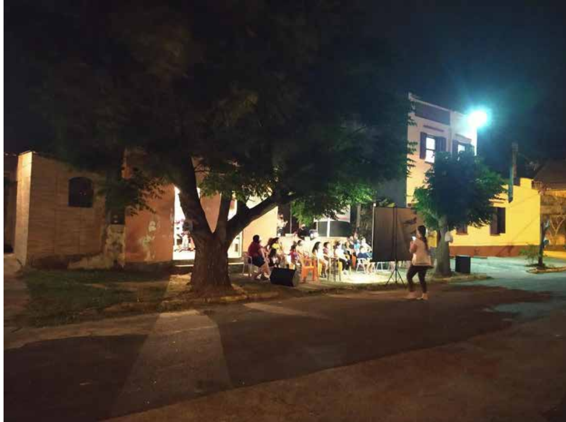
Figura 8 – Foto do evento na calçada do bar do Maurício.

chuva aumentou, a inquietude das crianças também e eu receosa de perder o controle preferi parar o filme. Para mim foi um alívio.