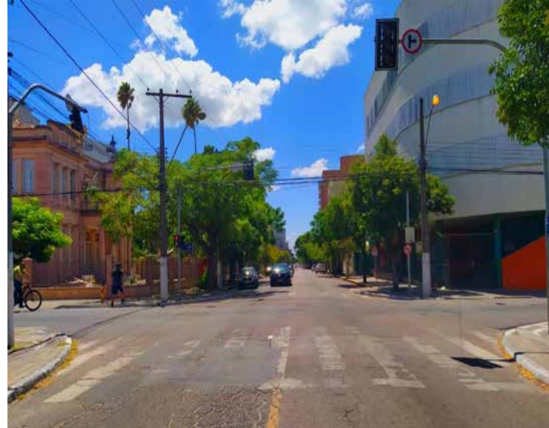
Figura 2- Fotografia do cruzamento onde podemos ver a esquerda a escola rosa e a direita o colégio laranja..

O desejo de romper os muros das intuições de ensino, presente na extensão, procura encontrar formas de provocar a reflexão e transformá-la em ação. Nesse movimento acredito que um dos caminhos é poetizar o espaço urbano: inventar o que fazer (OITICICA, 1978); ampliar suas funções, criar utopias em lugares cotidianos a fim de democratizar seu uso e as decisões sobre ele. Reconhecendo a importância dos espaços educacionais e a necessidade de transformação, impor intervenções sem compreender a percepção e as relações que os usuários estabelecem ali me parece uma ação tão pouco ética como pouco efetiva. Paulo Freire nos ensina que o trabalho social, comprometido com seu papel histórico, reconhece que a mudança deve partir da reflexão e do conhecimento sobre a percepção que outras pessoas têm da realidade (FREIRE, 1979). Acredito que para propor ferramentas potentes é necessário desenvolvê-las de forma atenta a percepção e aspirações de quem ali habita. Ela deve partir da reflexão coletiva sobre a ambiência existente e suas possibilidades. Dessa forma, a pesquisa e a ação se apoiam em uma metodologia engajada que provoca a reflexão sobre a cultura de uso dos espaços estudados