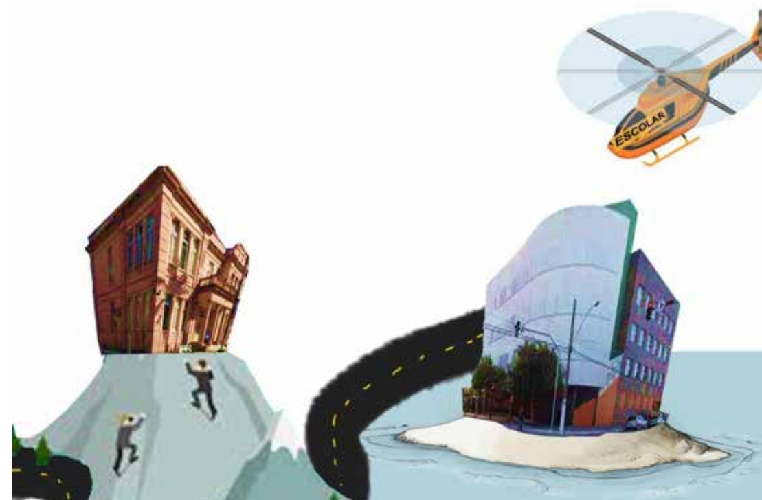
Figura 10- Escolas Ilhas – Diferente condição de isolamento das instituições.

As duas exposições se deram no raio de pouco mais de 1 km de distância da Escola Rosa e do Colégio Laranja. As diferenças entre elas e o imaginário que eu havia criado sobre a vivência urbana infantil ressaltam que as crianças e suas experiências não podem ser analisadas em bloco. Um bairro na cidade pode ser classificado quanto a sua renda,