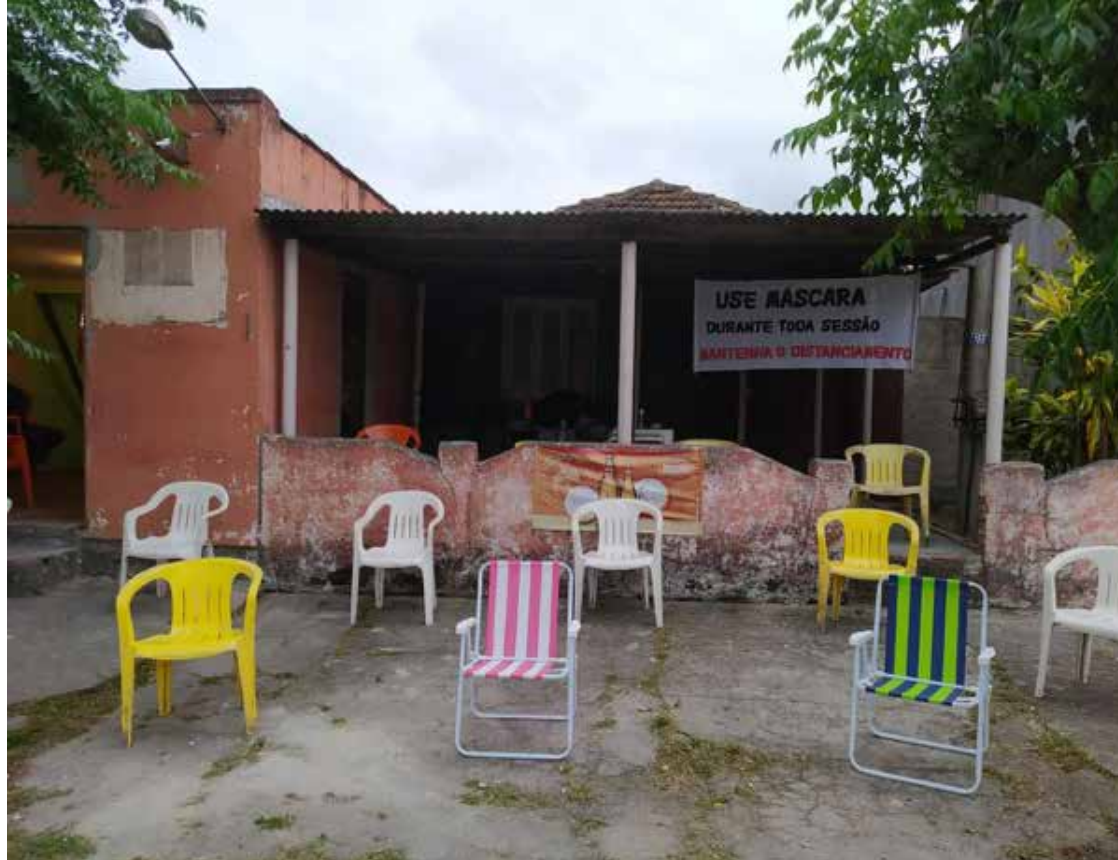
Figura 6 – Estrutura já montada na varanda do bar com destaque para faixa de aviso.

repetia “estão preparados para se envolver? aqui é assim, fortes emoções “. Além da torta, os amigos do bar fizeram uma vaquinha para comprar uma cachorrinha de pelúcia, que Bruno, aniversariante, nomeou de poppy e um outro cachorrinho que pula e late no chão, ele ficou fascinado. Todos alegres festejando o “Rei do Bar”. Fui embora nas nuvens, que lugar peculiar, um bar que também é acolhimento e pertencimento para um menino com Síndrome de Down. Saímos de lá também nos sentindo acolhidos, pertencentes e ansiosos para retornar com o evento.