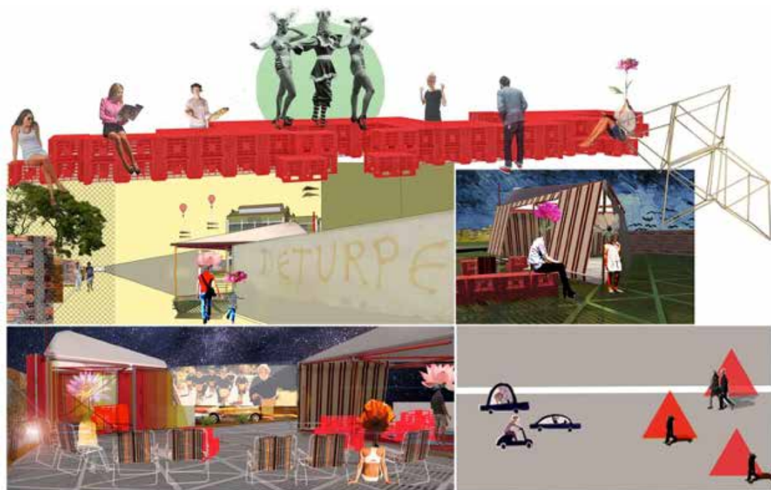
Figura 1- Recortes do trabalho UFPel na rua.

Reconheço em mim a veia extensionista que circula na UFPel desde o trabalho final da graduação em Arquitetura e Urbanismo, no ano de 2017. Na ocasião projetei um equipamento para dar suporte e incentivar ações de extensão universitária: consistia em uma estrutura efêmera pensada para ser transportada, montada e desmontada facilmente. Podia funcionar como palco para apresentações, lugar para exposições, palestras, reuniões, ou o que quer que fosse necessário para extensão da atividade acadêmica. Como parte dos requisitos para conclusão do curso, simulei algumas implantações da estrutura projetada. Um desses exercícios imaginativos pretendia levar a extensão para uma rua na periferia de Pelotas onde ficam localizadas duas escolas públicas. Nesta criação foram instalados em frente às escolas um palco, uma biblioteca e um cinema (figura 01). Finalizada essa etapa, algo me incomodava: como podia eu, sem saber sobre aquela realidade propor uma intervenção no espaço? Essa curiosidade me levou a adentrar no mestrado convicta do desejo de fazer uma intervenção no espaço que partisse dos desejos e necessidades de seus usuários cotidianos. Além disso, seguia comigo a vontade de trabalhar a conexão entre escola e cidade. Trabalho no entorno escolar por acreditar na potência desse espaço.