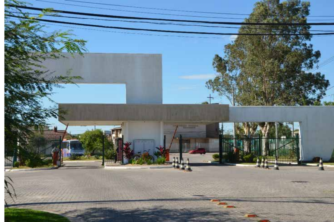
Figura 1 - Acesso, restrição, fiscalização – O portico de acesso ao Conjunto Residencial.