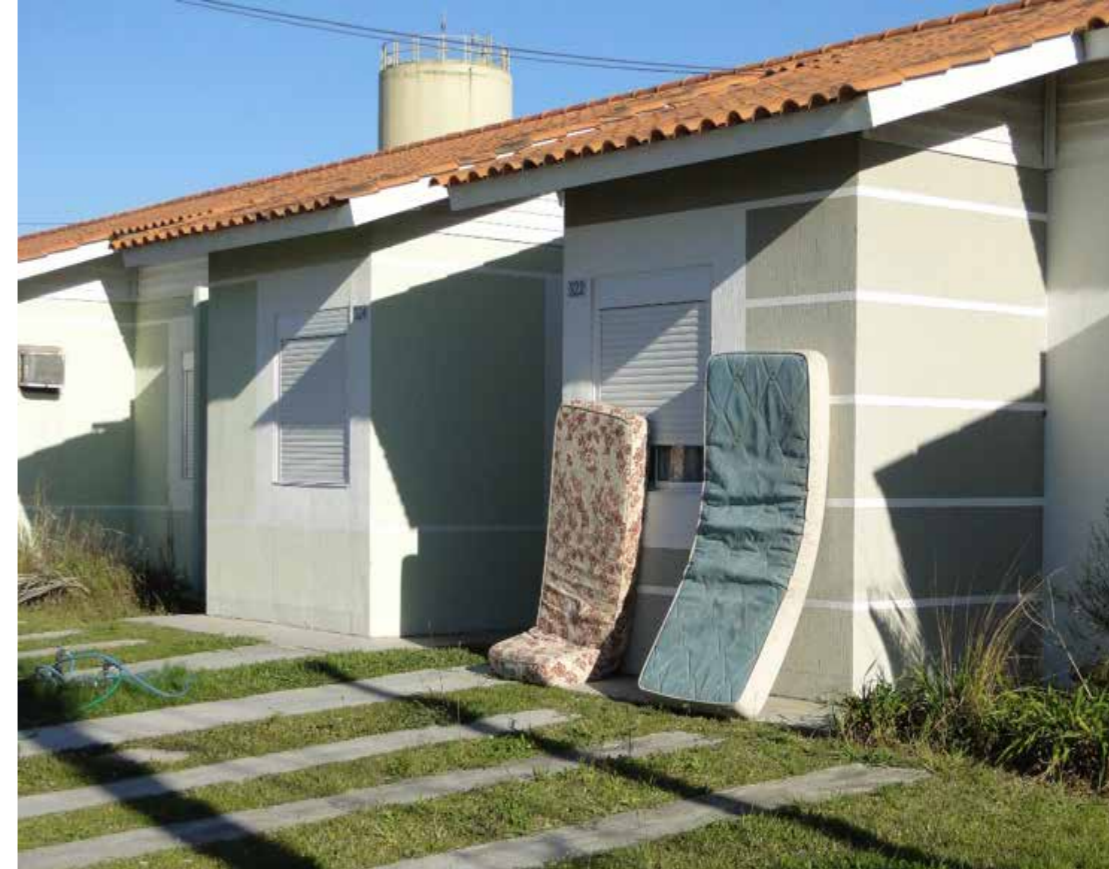
Figura 3 - Resquícios de uma noite infantil.

Essa reflexão opera em três camadas: em um primeiro, entender o habitar doméstico, adentrar nas casas e entender suas dinâmicas, buscando entender como a vida