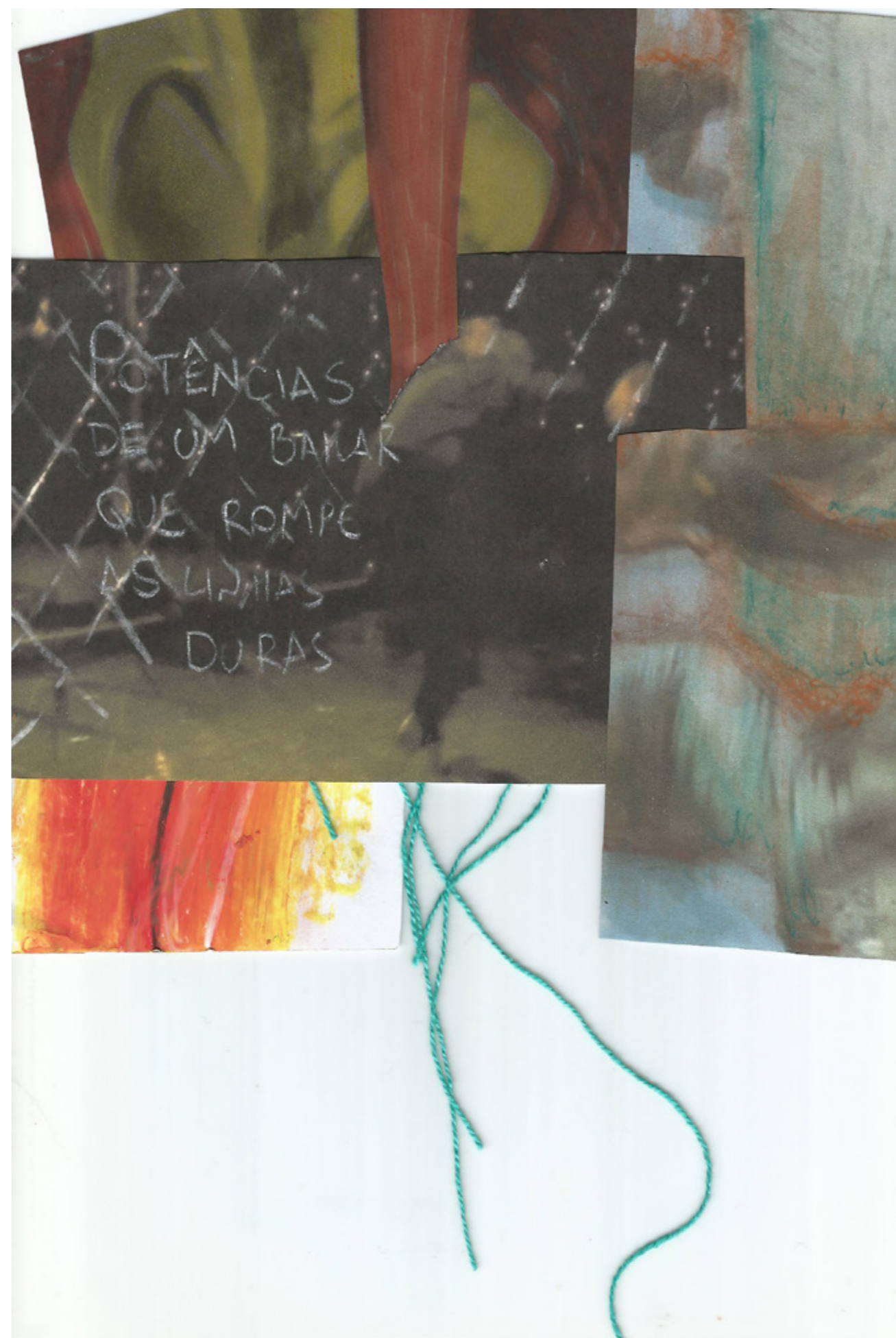
Imagem 4 - colagem produzida pelo primeiro autor a partir de criações coletivas junto do Grupo de Orientação.

Defendemos e vemos ganhar força aqui uma criação em pesquisa que toma para si a colagem como mobilizadora das linhas de força da própria pesquisa. Assim, permite emergir, por entre suas durezas, linhas de fuga que convidam a uma dança. Um baile. Defendemos e vemos ganhar força aqui uma criação em pesquisa que nunca se desassocia das demais esferas de vida dos corpos-pesquisadores. Pois as durezas com as quais nos deparamos ao longo dos escritos não deixam de ser a expressão de parte de nossas durezas construídas ao longo das aberturas que cada corpo faz e refaz em sua existência. Encará-las de frente não é tarefa fácil, e é neste sentido que a criação de métodos que nos permitam lidar com as rigidezes — não ignorá-las nem contar com seu apagamento — ganha força. Trata-se mais de um movimento de romper, de rachar, de transbordar, de extravasar. Enfim, de dar consistência provisória a toda uma multiplicidade de linhas que pedem passagem na constituição dos planos que a docência-pesquisa faz — e que fazem a docência-pesquisa.