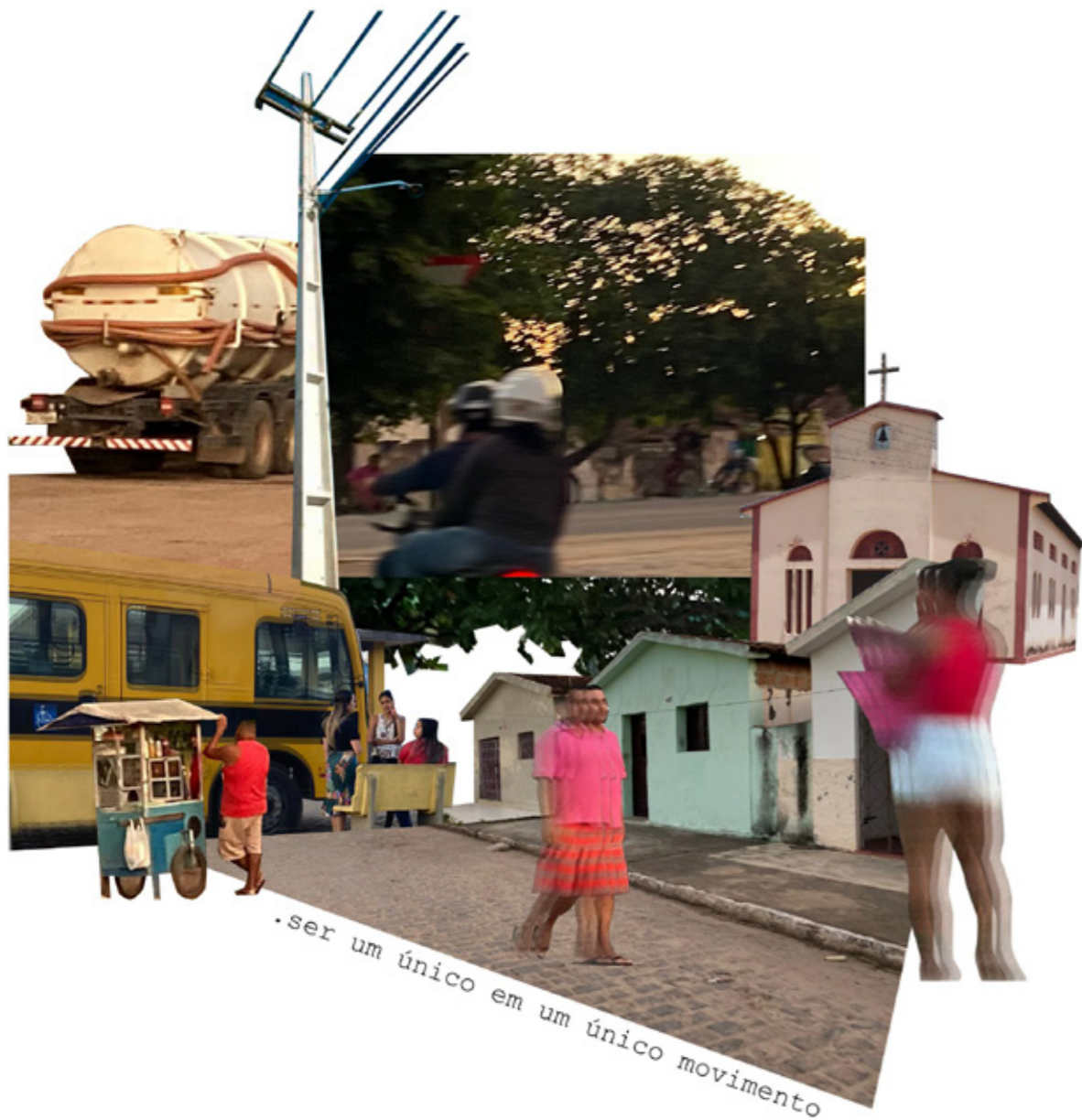
Figura 9 - Collage urbana "Vida em movimento" com tema do ir e vir do interior para a capital. Fonte: A pesquisa, 2022.

Filhos nos esquadros ou bagageiros brincando, Observando, criando afetividades Com o meio urbano, que também há Essência rural, onde já se viu? Tanto boi, tanto animal? A cidade que tem espaços para todos Até para o cachorro que parou para descansar Em frente ao bar, que vende tudo Onde Mainha pede para eu comprar Sovertes, comidas e guloseimas Para o laço firmar, Tudo acontecendo na calçada Unhas sendo feitas, conversas em alta Me sinto parte da cidade e Sinto a cidade meu lar