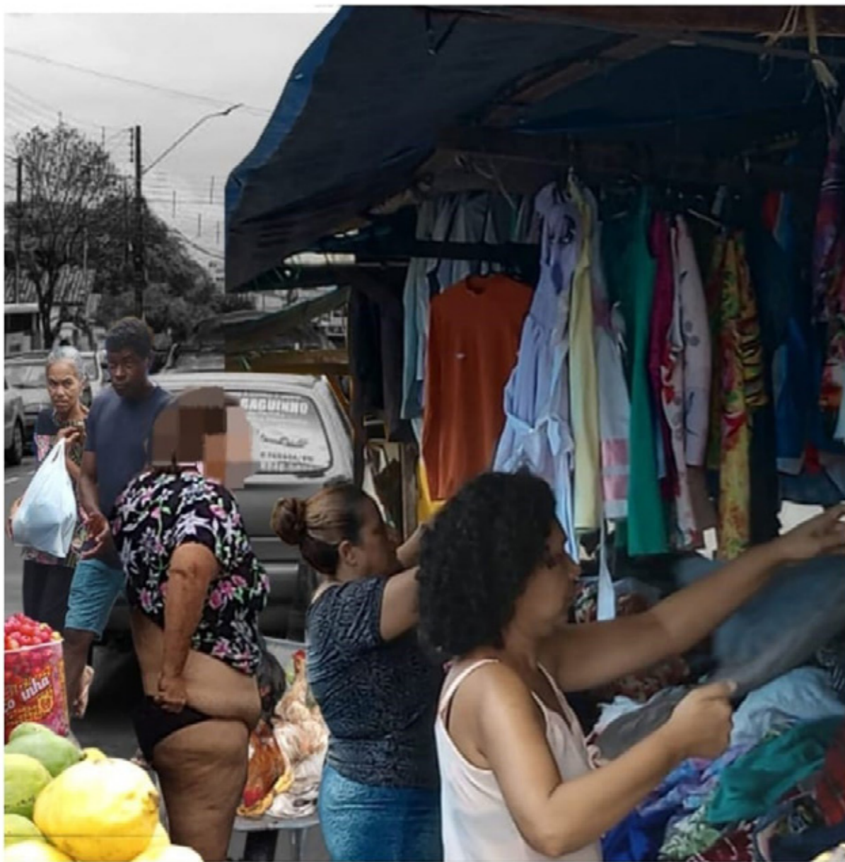
Figura 4 - Collage urbana "Tudo em um só lugar..." com tema da feira como lugar de afeto.

circunvizinhas". Em 1975 foi construído um mercado público com o objetivo de liberar o espaço para a construção do novo Centro Administrativo da capital. Hoje, a feira e o mercado funcionam juntos e são considerados locais de trabalho e sociabilidade tradicionais de diversas famílias há anos. Portanto, o poema e a collage (figura 4) "Tudo em um só lugar..." tratam da riqueza e pluralidade desse espaço, resistindo às transformações da cidade ao longo do tempo, mantendo-se local de conhecimento, tradição, memórias e afetos.