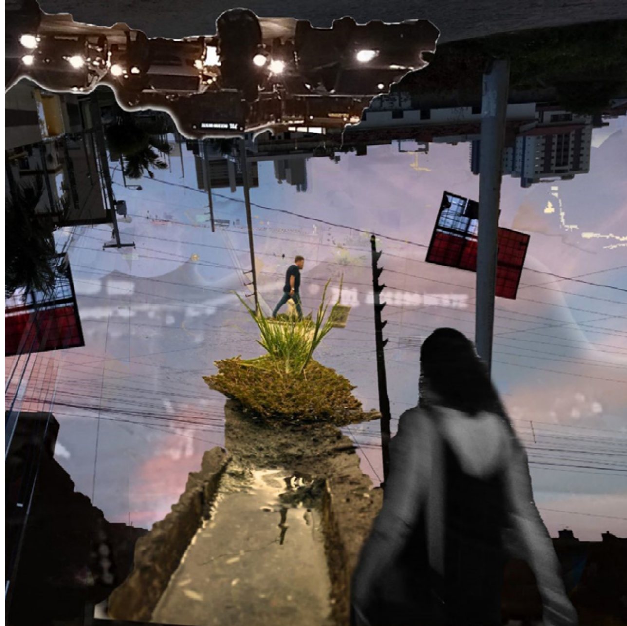
Figura 2 - Collage urbana "Arrasta Arrasta" com tema do desconforto da paisagem na cidade. Fonte: A pesquisa, 2023.

brasileiras. É pouco usual uma vez que compreender o transporte coletivo enquanto ferramenta de autonomia e liberdade vai na contramão do discurso dominante em um modelo rodoviarista de desenvolvimento, no qual grande parte dos investimentos de infraestrutura não priorizam modais coletivos e alternativos, mas privilegiam o transporte individual, através de obras de alargamento, viadutos e entroncamentos rodoviários. Tudo isso enquanto as ferramentas de comunicação em massa consolidam uma visão de independência na qual o carro é lido como símbolo de independência e de status social.