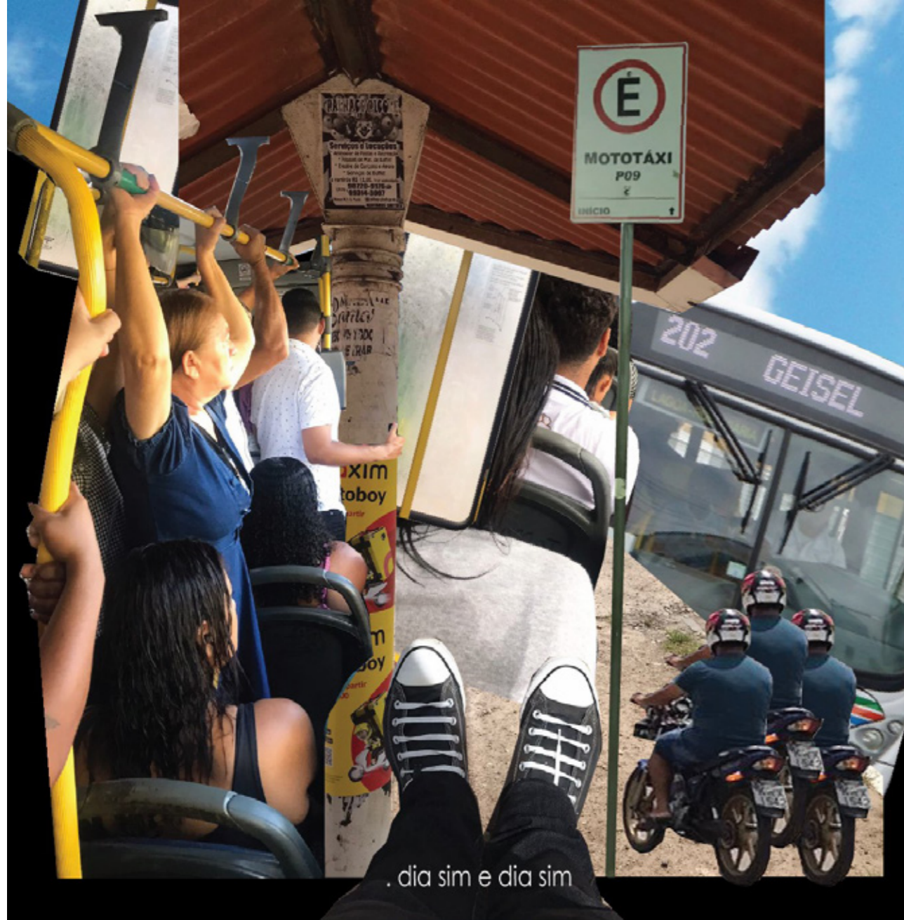
Figura 7 - Collage urbana "Dia sim e dia sim" com tema mudança do interior para a capital.

É uma rotina cansativa Se sentar é agradecer, se ficar em pé, ter cuidado com a inércia Essas situações poderiam ser dia sim e dia não Mas na cidade grande o caos é contínuo.