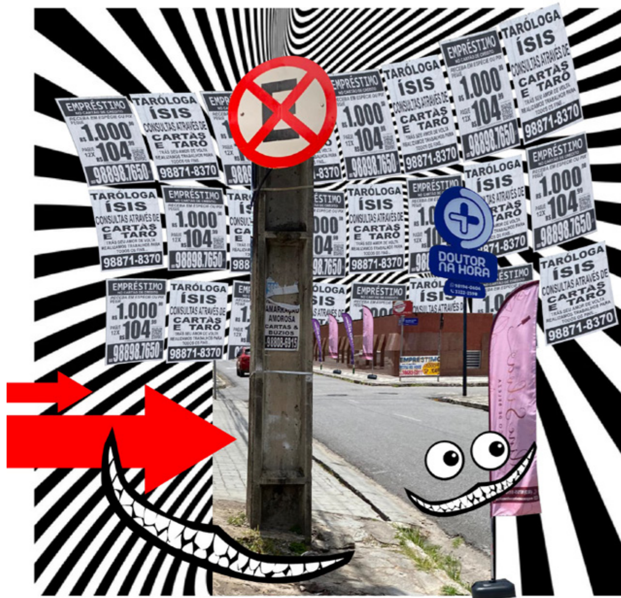
Figura 1 - Collage urbana "delírios" com tema da poluição visual.

uma modalidade de publicidade produzida para a escala e velocidade do automóvel. Daí surge a interpretação da errante sobre a paisagem, que ao sentir-se desconhecida no processo de construção da paisagem, revela os "sorrisos e enganação" à que se refere no poema e que completam a collage .