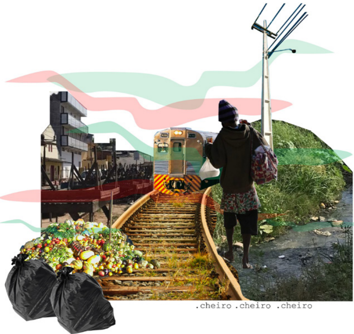
Figura 5 - Collage urbana "O cheiro da quarta feira" com tema da sujeira no ambiente urbano.