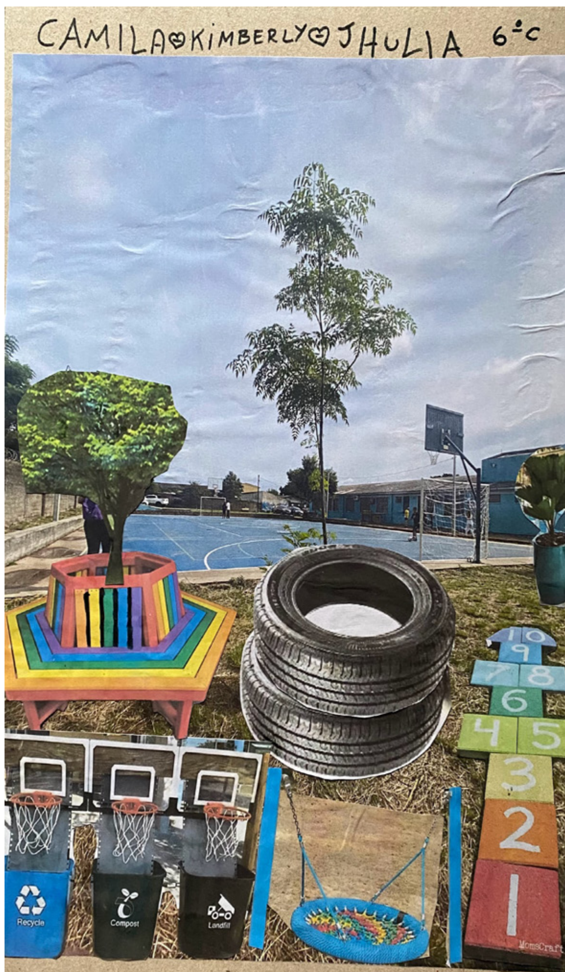
Figura 7 - Collage do pátio resultante da oficina com uso de brinquedos e vegetação. Aqui aparece o uso de lixeiras recicláveis com tabelas de basquete proposta pela Camila, Kimberly e Jhulia.