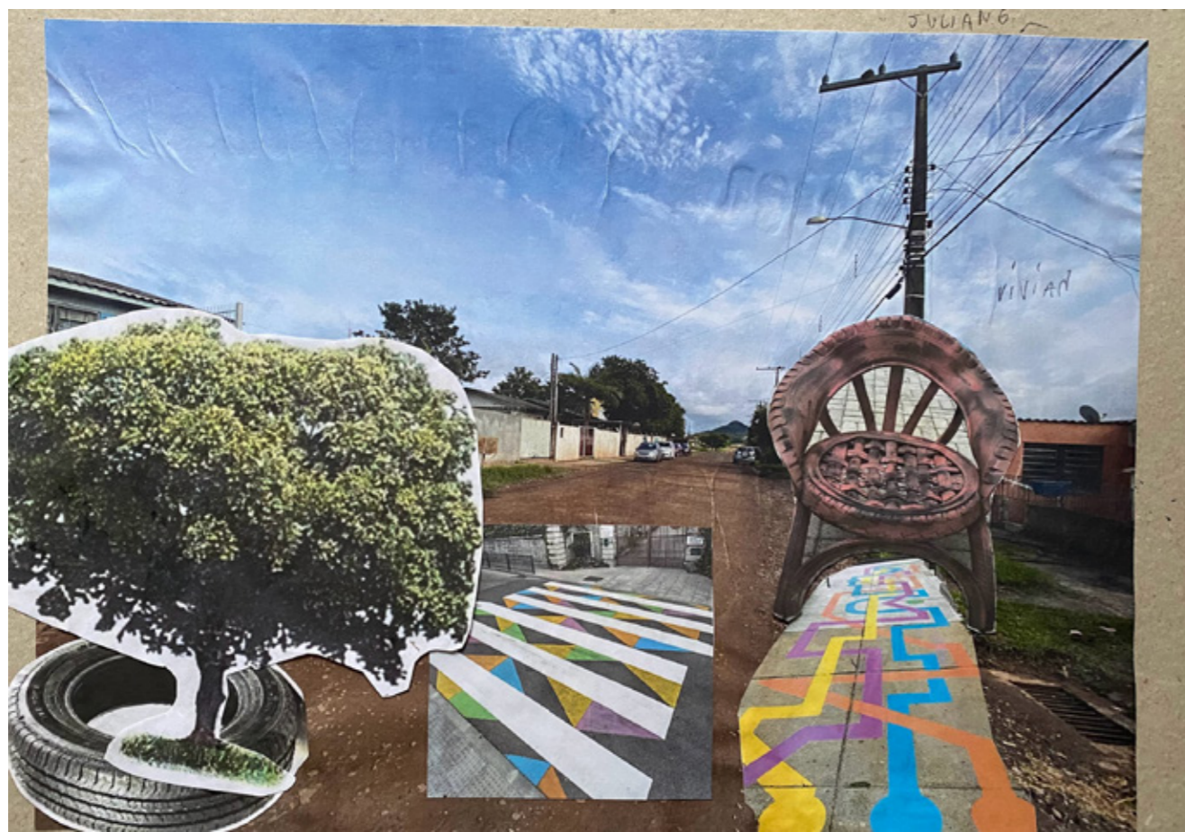
Figura 4 - Collage da rua de acesso resultante da oficina, nela podemos observar o acréscimo de vegetação e de uma parada de ônibus proposta pela Vivian. Figura 5 - Collage da rua de acesso resultante da oficina, nela podemos observar o acréscimo de calçadas e pavimentação colorida, assim como mais vegetação propostas pelo Juliano. A poltrona serve para representar áreas de estar e proteção contra intempéries.