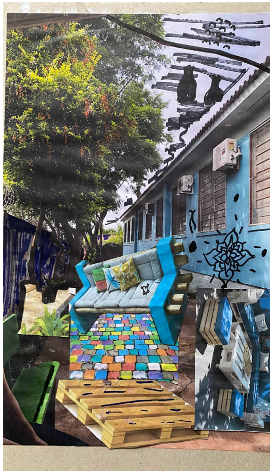
Figura 8 - Collage da lateral da escola, onde atualmente não tem uso, resultante da oficina. Neste espaço os alunos propuseram a construção de um local de estar com sofás, bancos e paletes. Fonte: Acervo das autoras, 2023.