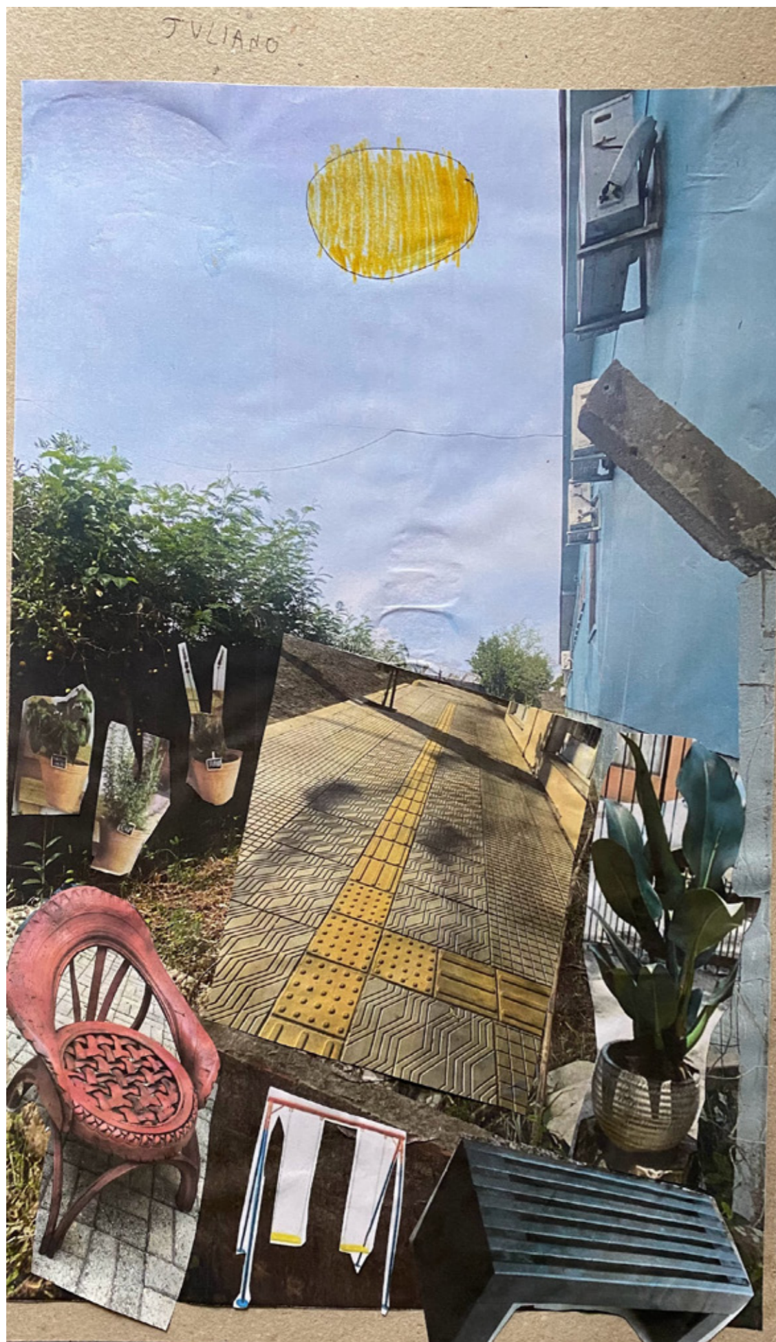
Figura 9 - Collage da lateral da escola, onde atualmente não tem uso, resultante da oficina. Neste espaço os alunos propuseram a colocação de pavimentação, vegetação em vasos no piso e no muro, assim como bancos e balanços para as brincadeiras do recreio.