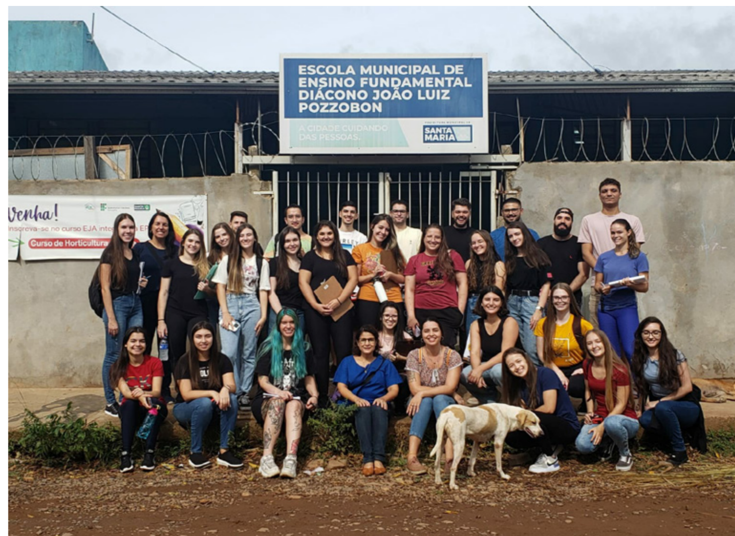
Figura 10 - Turma de Ateliê de Urbanismo e Paisagismo no acesso da escola.