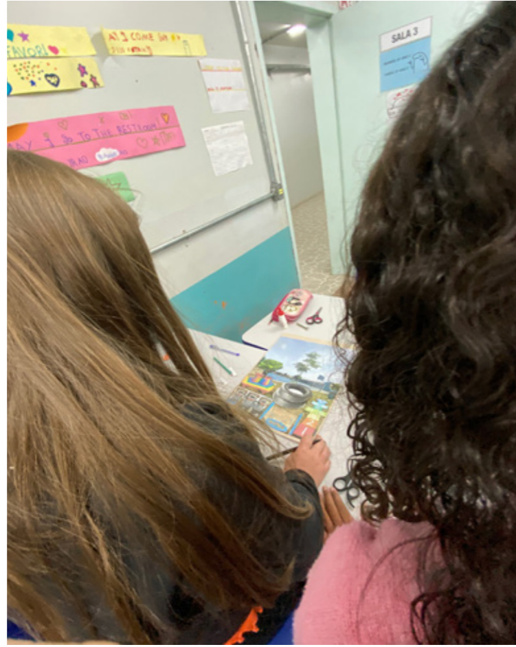
Figuras 1 e 2 - Realização da oficina "Cola Escola" na escola Diácono Pozzobon.