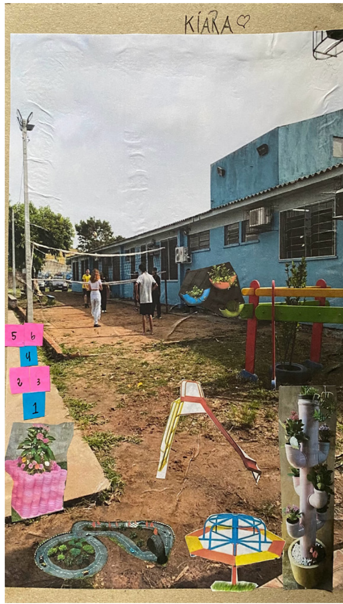
Figura 6 - Collage do pátio resultante da oficina com uso de brinquedos formando uma praçinha proposta pela Kiara. Atualmente a escola não possui este uso no pátio.