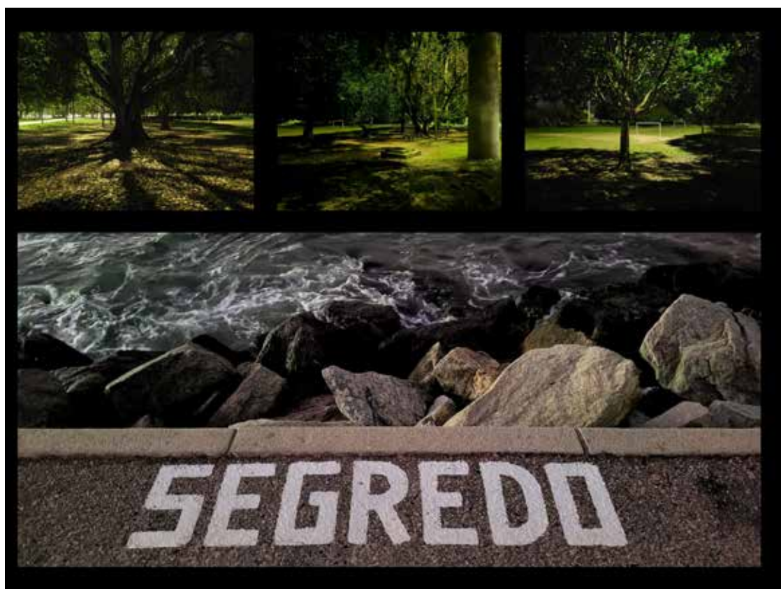
Figura 2 - Aterro do Flamengo à noite. Autoria própria, 2022. Colagem digital. Autoria própria, 2022.

A prática da pegação é realizada em inúmeras cidades do mundo. Existem, por exemplo, guias que explicitam que os territórios libidinosos fazem parte da cidade tal qual a sexualidade faz parte de nossos corpos. No Rio de Janeiro, essa navegação por prazer também acontece e é histórica. Como informa James Green em seu livro 'Além do Carnaval', desde o fim do século XIX até recentemente, pontos como o Largo do Rossio, atualmente Praça Tiradentes, configuraram locais de homossociabilidade (GREEN, 1999 p.57) em especial no período noturno. Nos dias atuais, um dos lugares mais conhecidos em que a prática acontece é o Parque do Flamengo. Amadei e Pedrotti (2022), no artigo 'Entre Plantas e Prazeres', trazem também alguns antecedentes, a partir de evidências históricas, que sugerem que a pegação no Parque do Flamengo também é histórica, datando desde 1972 as menções midiáticas sobre a prática. Em