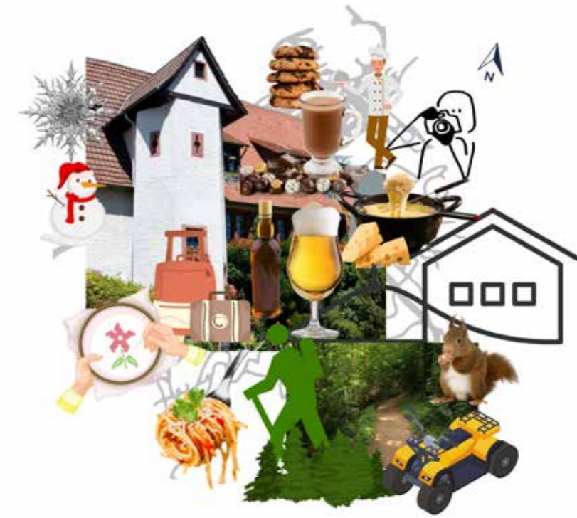
Figura 3 - Representação dos ícones presentes na cartografia de experiências a partir das narrativas.

A terceira temática destacada e intitulada como flâneur diz respeito aos termos passeios, caminhada, rua, galerias e artesanato. É claro, que por vezes alguns destes termos se esbarram com o consumo no espaço, mas por ora vamos considerá-los como consumo do espaço. As galerias são constituídas por lojas onde em muitas delas