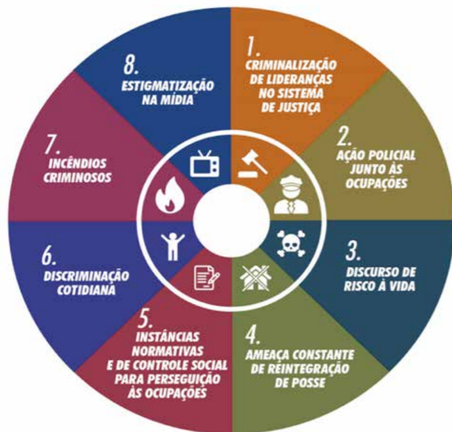
Figura 1 - Infográfico oito faces da criminalização dos movimentos de moradia.