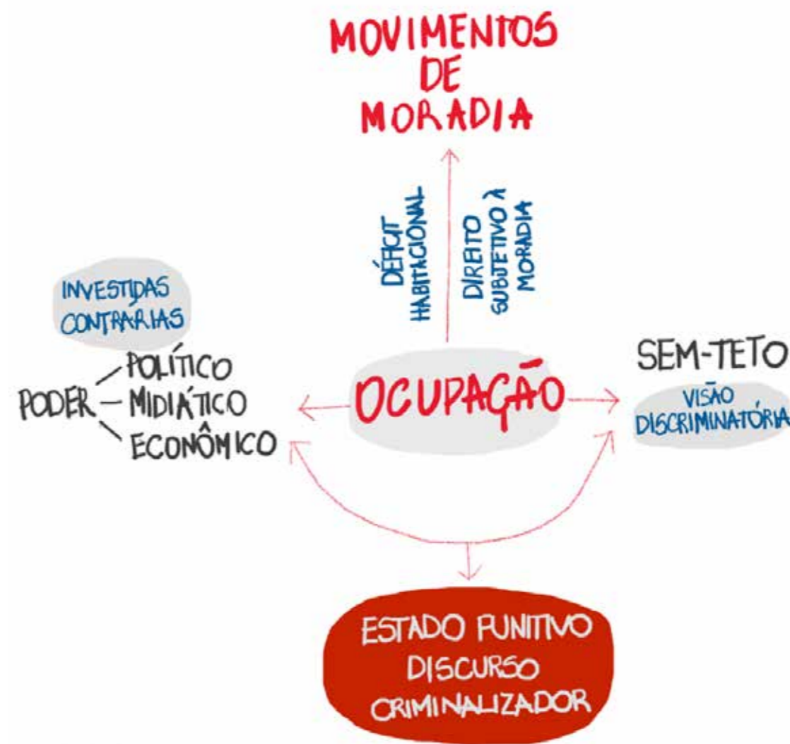
Figura 4 - Ação Opressora aos Movimentos de Moradia.

Assim como a conscientização não ocorre sem a práxis , ou seja, é parte dela, em um processo contínuo de ação-reflexão, nos Manuscritos de Paulo Freire, de 1968 (Figura 2), para sua clássica obra Pedagogia do Oprimido, ele nos lembra que a ação, quando revolucionária, também implica na necessidade do diálogo para que os atores possam agir sobre o objeto, sobre a sua própria realidade, transformando-a e humanizando as pessoas. Por outro lado, em uma ação opressora a prática é antidialógica, sendo os