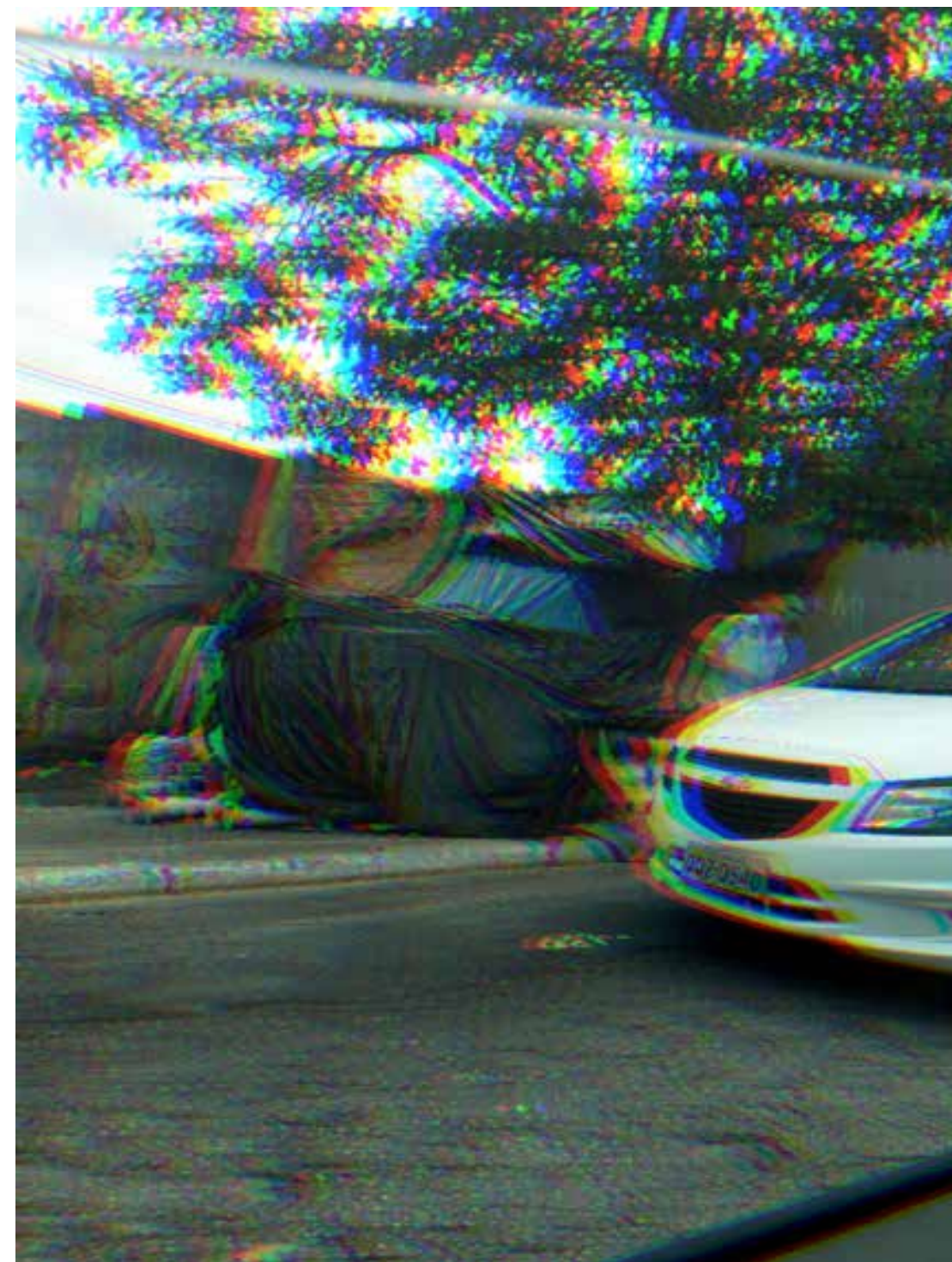
Figura 1 - INTER(AÇÃO) NATUREZA URBANA.

A “interferência” da natureza no ambiente urbano. Apesar do ser humano tentar ditar regras comportamentais a natureza e se incomodar com sua presença tida erroneamente como invasiva, no fim é ela quem tem o controle e estabelece os passos. O “incomodo” gerado pela “invasão” da natureza no ambiente urbano e a distorção da visão humana em relação aos espaços ocupados pela natureza.