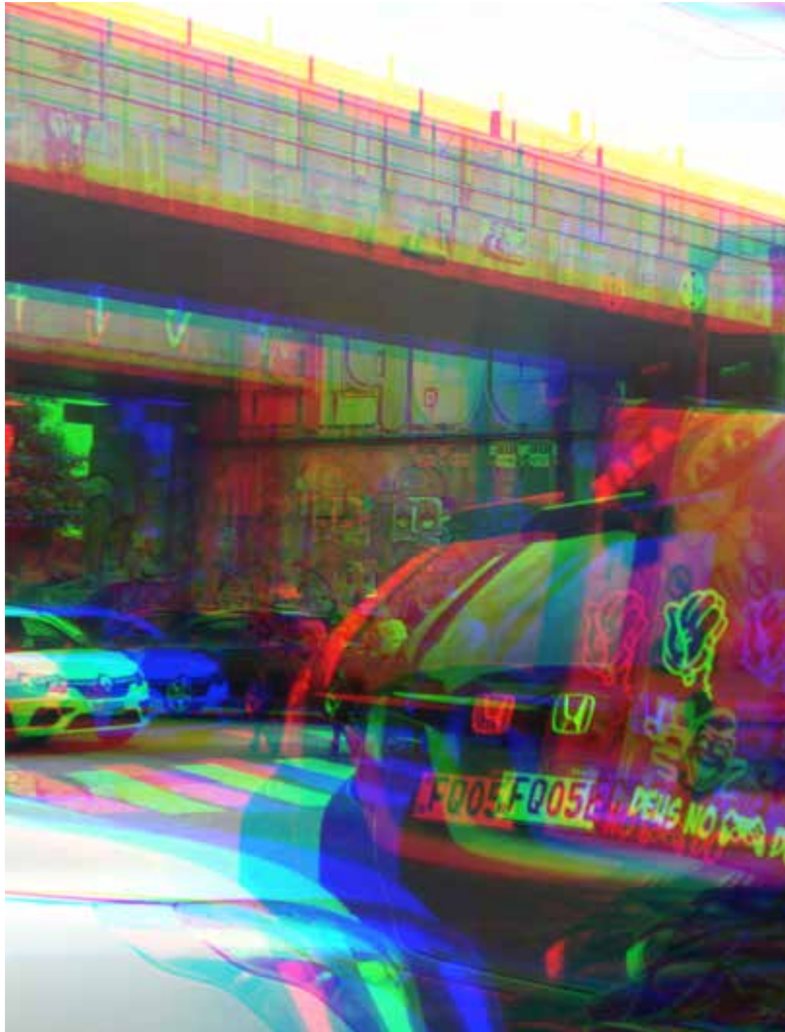
Figura 2 - INTER(AÇÃO) NATUREZA URBANA.