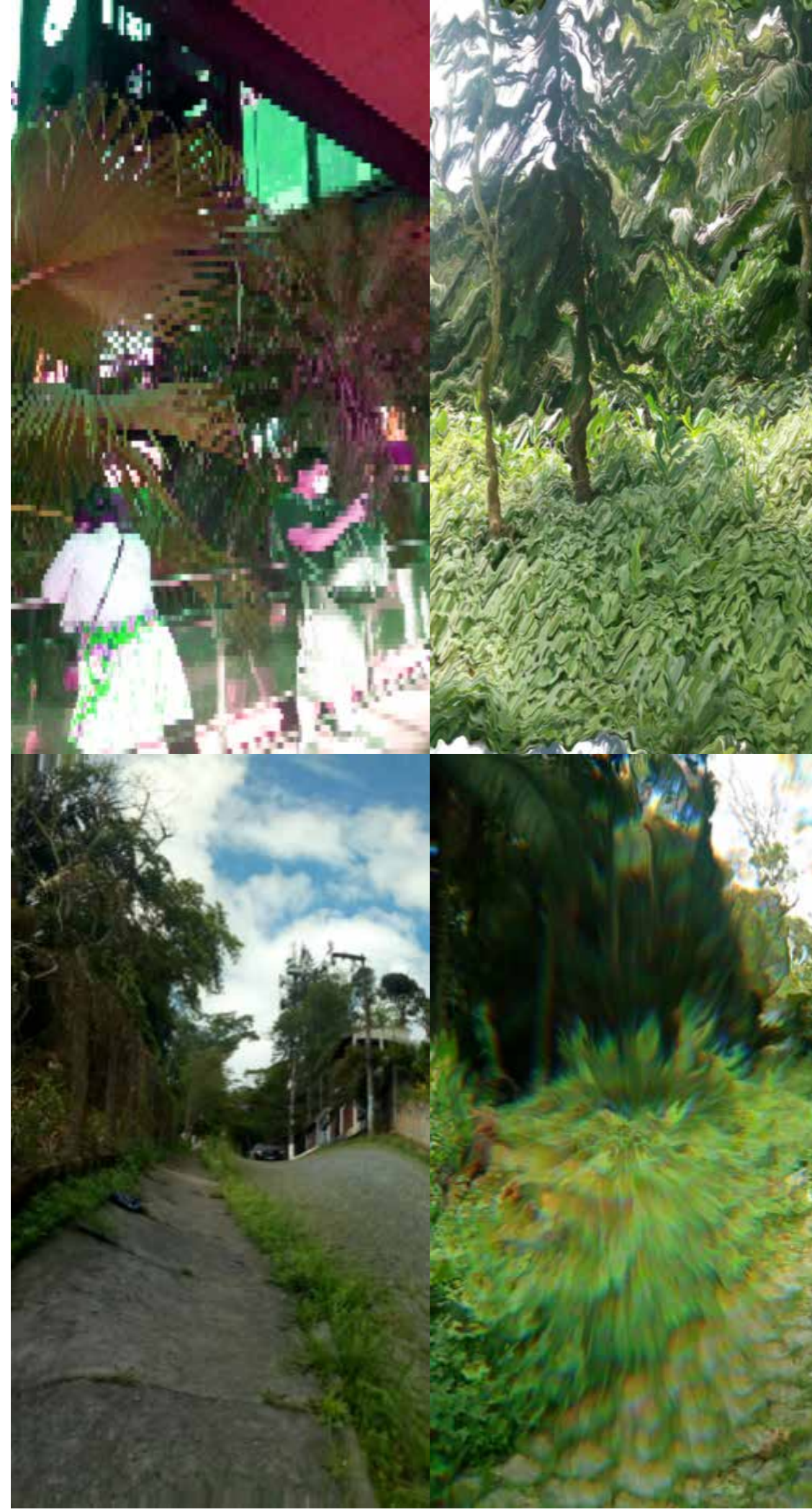
Figura 7 - INTER(AÇÃO) NATUREZA URBANA. Fonte: Elaborada pelos autores, 2020. Figura 8 - NATUREZA URB(AMA). Fonte: Elaborada pelos autores, 2020. Figura 9 - INTER(AÇÃO) NATUREZA URBANA. Fonte: Elaborada pelos autores, 2020. Figura 10 - NATUREZA URB(AMA). Fonte: Elaborada pelos autores, 2020.