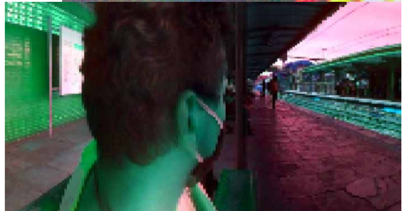
Figura 3 - INTER(AÇÃO) NATUREZA URBANA. Fonte: Elaborada pelos autores, 2020. Figura 4 - NATUREZA URB(AMA). Fonte: Elaborada pelos autores, 2020.