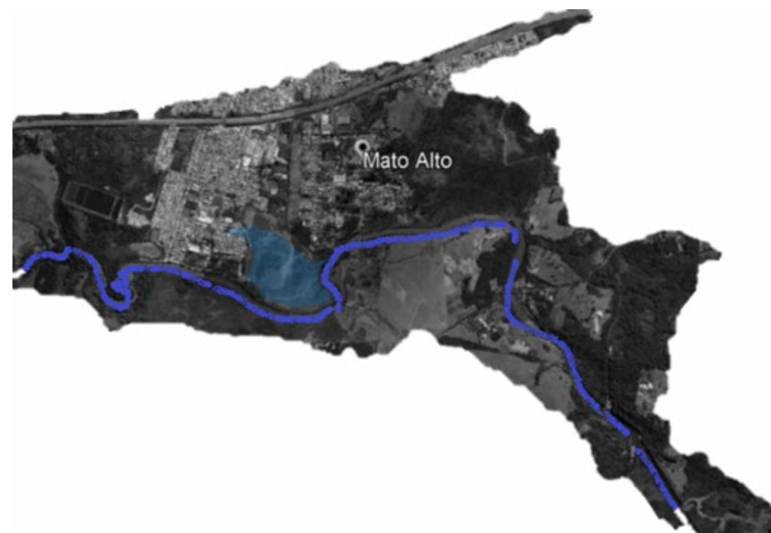
Figura 1 - Rio Gravataí, Gravataí-RS.

A mata da Orquídea que se via nas imagens de satélite possuía contornos definidos, contudo, eles foram borrados. Buscou-se reconstituir elos perdidos entre ela e a mata ciliar do Rio Gravataí. Por outro lado, buscou-se enlaçá-la com o tecido urbano do município e do seu loteamento do Mato Alto, bem como com o conjunto habitacional que a ladeava. Tratava-se de dismantelar fronteiras entre espécies humanas e não-