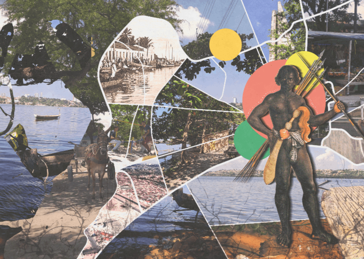
Colagem 3 - Homem Africano - Ubuntu, as cidades são várias e também nós (montagem urbana do bairro Vergel do Lago).

seus próprios celulares, a fim de mostrar as histórias, impactos e percepções locais sobre a pandemia de Covid-19.