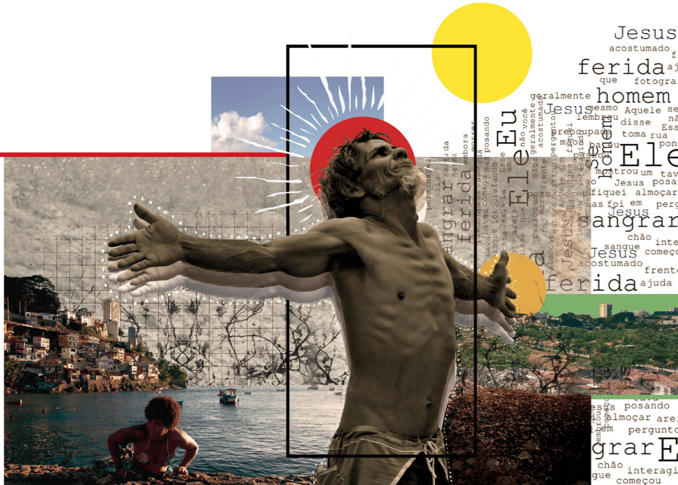
Colagem 1 - Aquele Homem - série Transcender: a Cidade dos Sonhos Negros.

então se originam os estudos e discussões aqui apresentados: é preciso contraponer, ou seja, construir mundos desejáveis por meio de contranarrativas que enfraquecem a hegemonia colonialista e potencializam cosmopercepções negras e ancestrais, transformando as “armas dos inimigos em defesa” (SANTOS, 2023). Dessa maneira, buscamos desconstruir imagens e narrativas colonialistas que associam a população negra a contextos negativos, retirando-a da condição de opressão e violência, de modo a apontar potentes contranarrativas de reinvenção, resistências e reexistências.