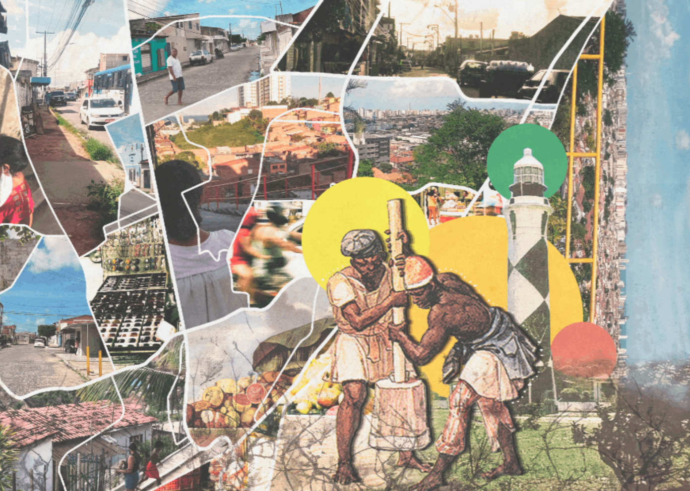
Colagem 5 - Calceteiros - Ubuntu, as cidades são várias e também nós (montagem urbana do bairro Jacintinho).

produzidas por 12 fotógrafos/as negros/as de vários estados brasileiros, ocorrida em Maceió, Alagoas em julho de 2022 e organizada pelo FotoSururu - Encontro de Fotografia Criativa em Maceió/AL. A citação acima foi retirada do texto de abertura da “Exposição Fotográfica Ser Negro”, feito por um dos curadores, Roger Silva 26 . Ela me serviu como mais um despertar do porque faço e penso nessa montagem urbana: a busca pela construção de imagens que faça pessoas negras serem vistas “com menos dor e mais amor” (SILVA, 2022, [S. p.]) e dessa forma também a mim enquanto pessoa negra. Ela também me despertou quanto ao motivo do uso da palavra Ubuntu para nomear as colagens produzidas.