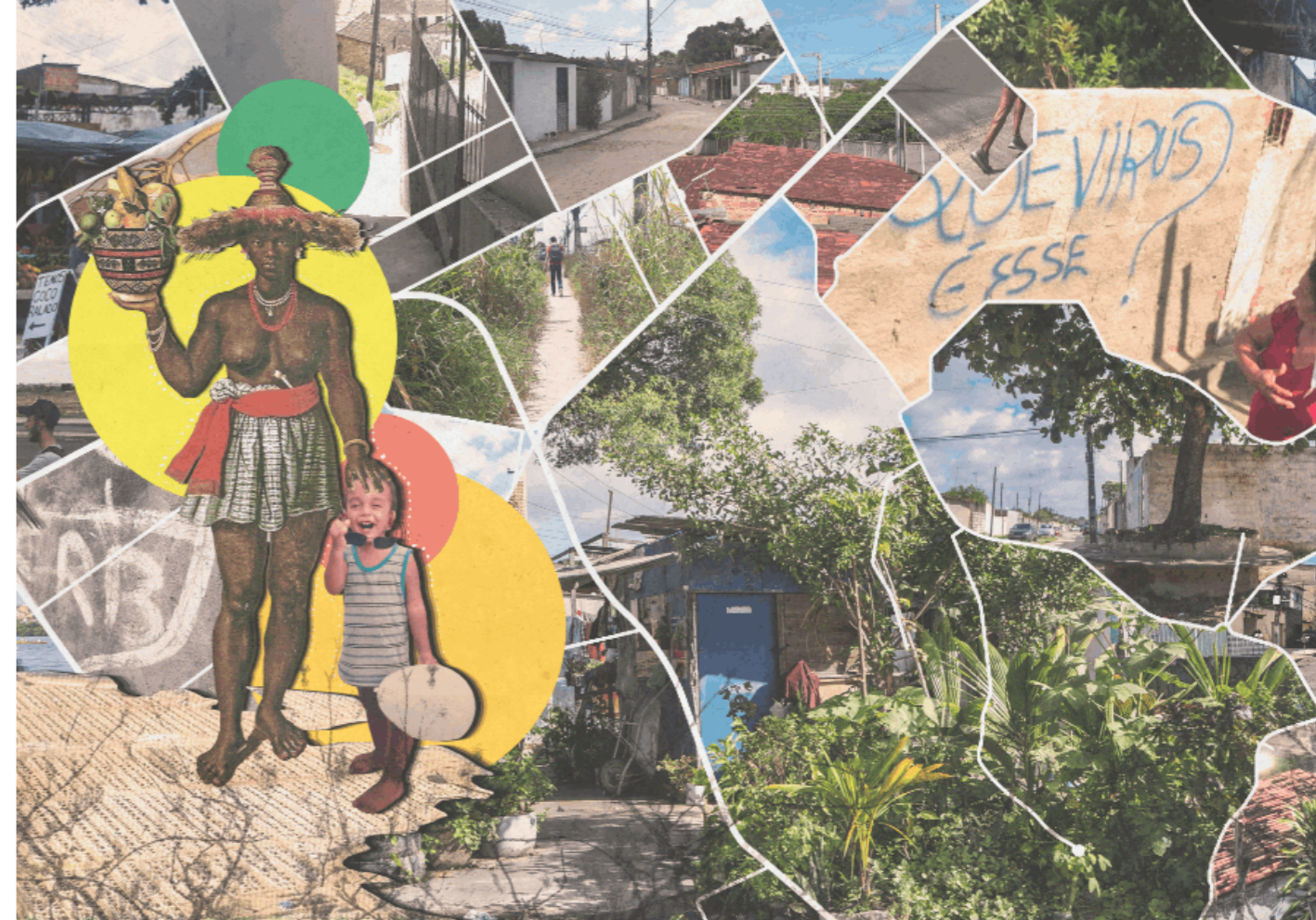
Colagem 4 - Mulher Africana - Ubuntu, as cidades são várias e também nós (montagem urbana do bairro Benedito Bentes).

Nesse processo de busca - pelas redes sociais, em contato com amigos e colegas, no acervo do Museu da Imagem e do Som de Alagoas, na busca de minhas fotografias da infância e de pinturas coloniais - foram sendo recolhidos fotografias/fragmentos dos bairros Vergel do Lago, Benedito Bentes e Jacintinho e o processo de montagem urbana foi acontecendo. Dessa maneira, intitulo o nome montagem urbana de “ Ubuntu , as cidades são várias e também nós” (ver Colagem 3, 4 e 5), na busca de sintetizar seu conceito de produção e de onde toma seus diversos partidos.