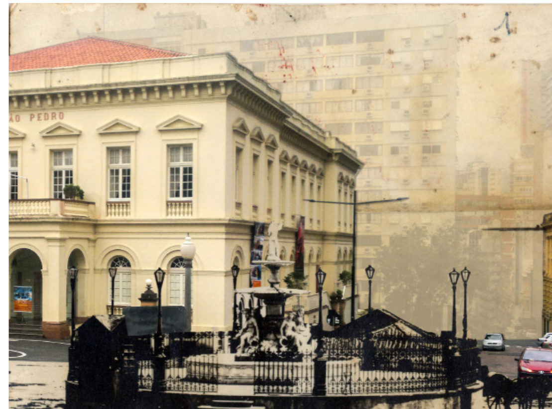
Figura 4 - Collage da frente do Theatro São Pedro, ressaltando a supressão da vista do Rio Guaíba ocasionada pelo crescimento dos prédios ao redor da Praça da Matriz. Felipe Rodrigues, 2017.

uma história deslocada, uma narrativa. A collage é o lugar onde se dá o encontro de uma linguagem amorosa, onde as figuras se revelam e exibem em sua essência, porque deixaram de ser índice através do recorte. (FUÃO, 2011, p.30-31).