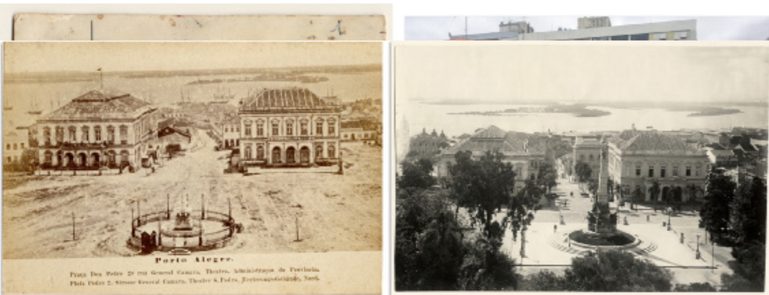
Figura 3 - Comparação entre as fotografias do Theatro São Pedro. Uma realizada em 1880 e a outra fotografia em 2017. Fonte: Museu de Porto Alegre Joaquim Felizardo, autor desconhecido, 1880; e foto: Felipe Rodrigues, 2017.

Posto isto, as fotografias podem ser entendidas como portadoras de memórias, por se tratarem de “instantes” congelados no tempo, dos processos de transformações urbanas em Porto Alegre. Porém as próprias fotografias que retrataram as metamorfoses urbanas também são fragmentárias, pois representam a cidade em partes. O ato fotográfico é sempre reduutivo, o fotógrafo sempre tem de fazer um recorte, intencional, do que pretende registrar. Fernando Fuão diz que “a fotografia e seu registro impresso constituem o fragmento, a figura de ação da collage” (2011, p. 13). A limitação do enquadramento não permite que se represente toda a cidade em uma só foto. Mas, a partir da junção de seus fragmentos é possível remontar a cidade, pois, “o todo não é a soma de partes ou fragmentos, embora os fragmentos façam o todo” (2011, p.14).