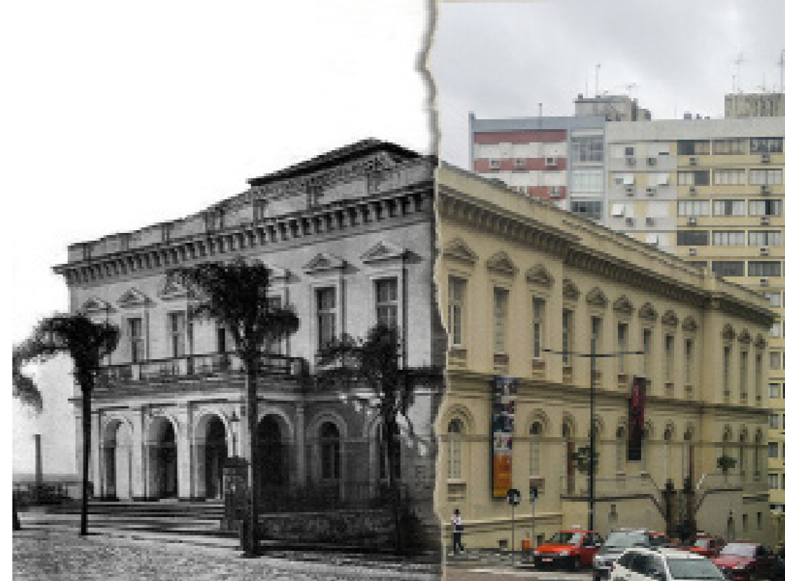
Figura 2 - Collage no Theatro São Pedro utilizando fotografias do passado e do presente. Fonte: Museu de Porto Alegre Joaquim Felizardo, autor Virgílio Calegari, década de 10; e foto: Felipe Rodrigues, 2017.