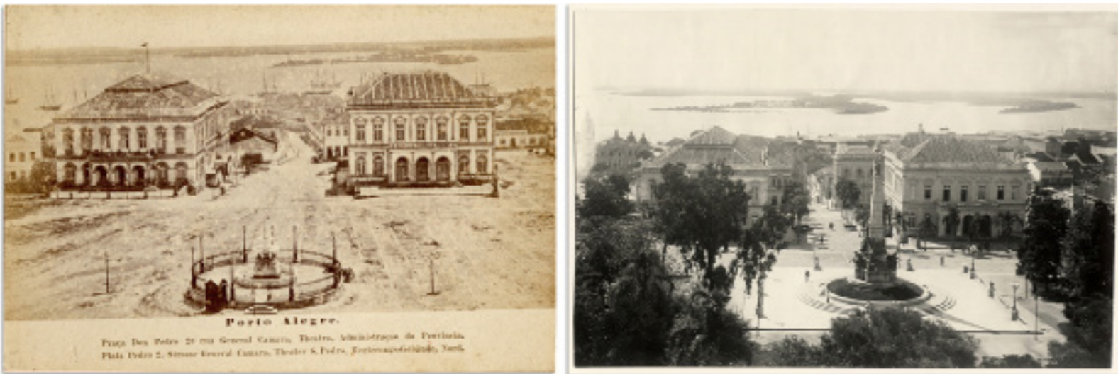
Figura 1 - Chafariz em alusão aos rios afluentes da Bacia do Guaíba em frente ao Theatro São Pedro. e fotografia com o Monumento a Júlio de Castilhos em frente ao Theatro São Pedro.

Muitos já representaram e seguem representando a Praça da Matriz. Desde viajantes como Jean Baptiste Debret e Herrmann Rudolf Wendroth, com suas pinturas, até fotógrafos, antigos ou contemporâneos. O que eles buscaram ao representar o local em imagens? Permanece algum resquício do Alto da Praia na forma da Praça da Matriz na atualidade? Com a collage, de tempos distintos, presentes nos fragmentos do passado, será possível evidenciar as suas intencionalidades. Bem como, dar visibilidade às memórias da cidade que ainda seguem presentes na Praça da Matriz.