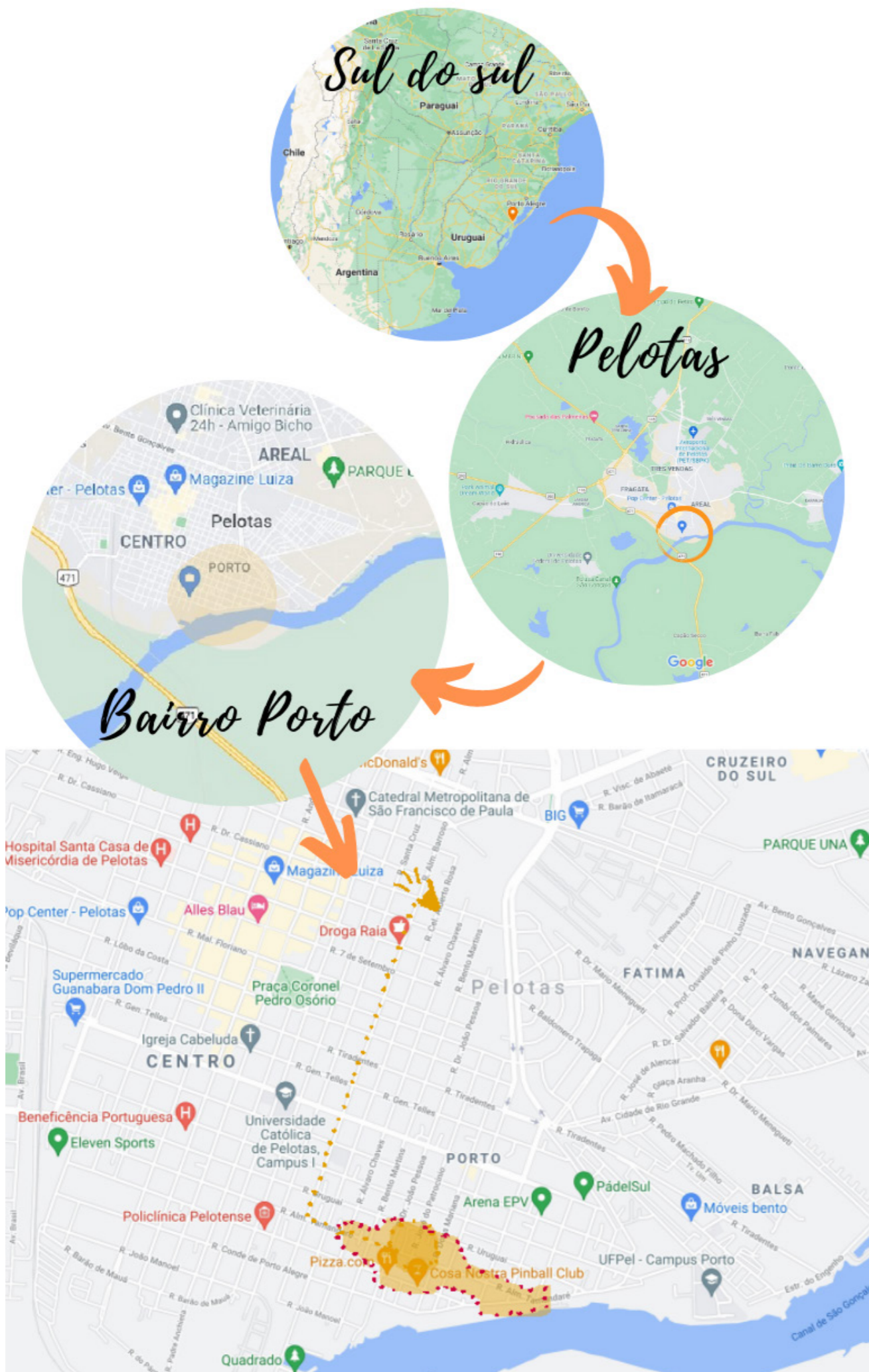
Figura 3 - Mapa das caminhografias.

A seguir, transcrevemos a caminhografia feita durante o evento “Sofá na Rua”, em setembro de 2019, os afectos e perceptos, através da narrativa dos caminhos percorridos no dia (Figura 3). Em seguida, a caminhografia feita junto ao grupo experimental e interdisciplinar Partendo dal Porto Portando , conduzido pela Prof. Dra. Emanuela di Felice, quando caminhamos na região portuária de Pelotas, em novembro de 2019.