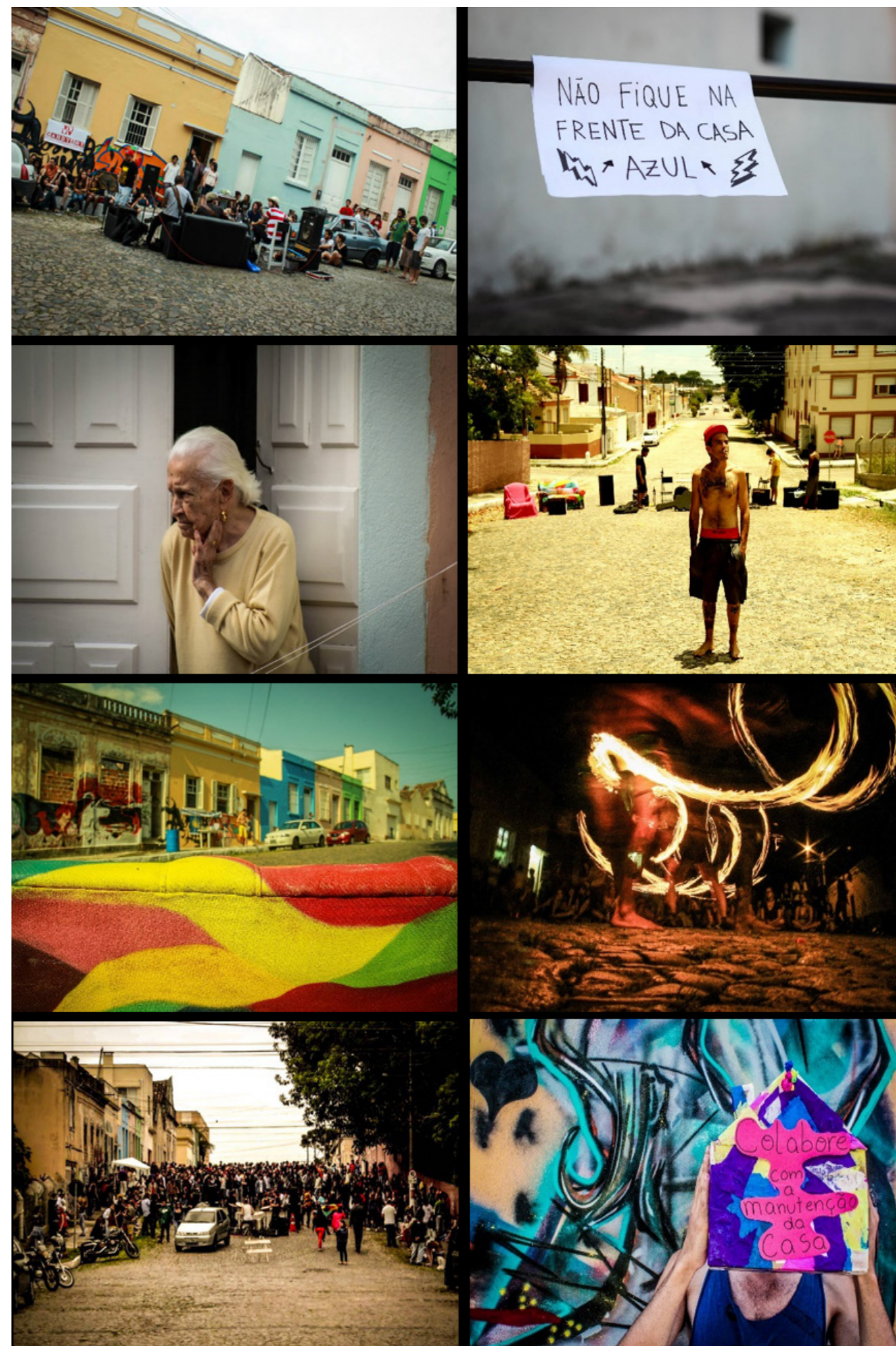
Figura 1 - Fotos oficiais do evento “Sofá na Rua”.