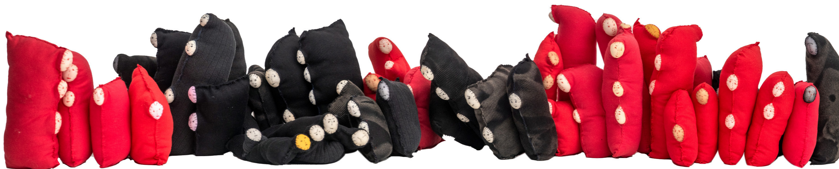
REFUGIADOS (2016/2024) dimensões variadas