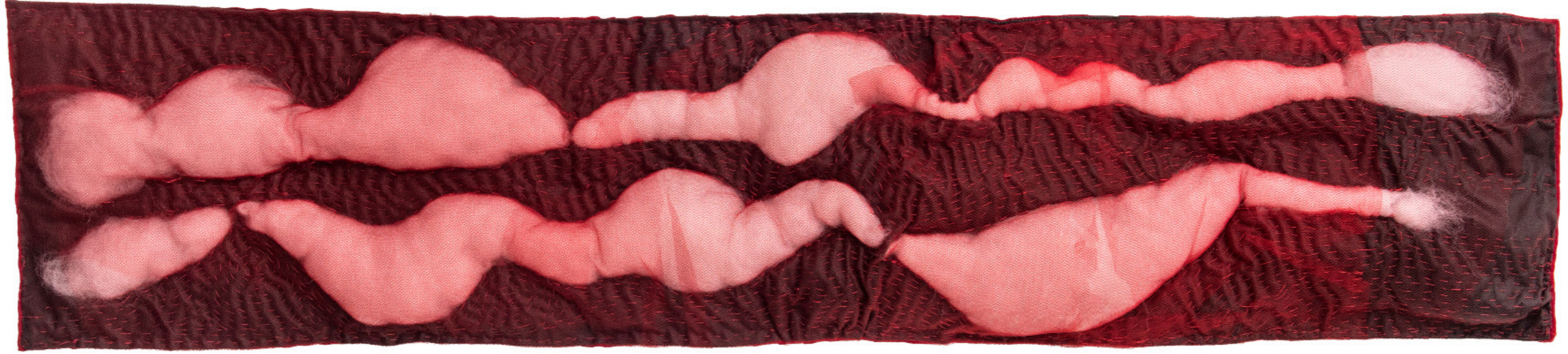
AMAZÓNIA (2022) - Don e Bruno 95X25cm