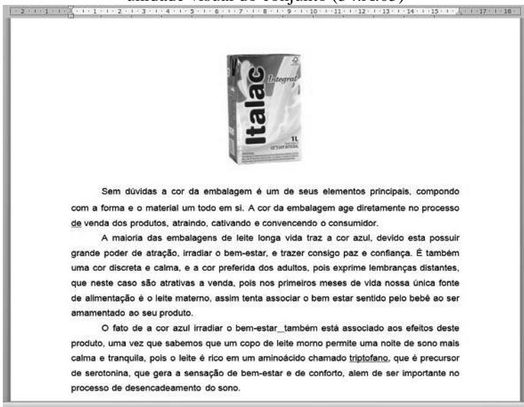
Figura 2 - Exemplo sem espaços em branco que comprometam a unidade visual do conjunto (34.A.05)

De nosso ponto de vista, esses dados são justificados por duas razões principais. Primeiramente, pelo fato de que a maioria absoluta dos universitários (92%) apresentou apenas um dado como resposta à atividade proposta, reduzindo, portanto, nível de dificuldade em manter a proximidade entre os elementos mobilizados. Mas esta não seria a única razão para o que foi encontrado nas produções textuais verbo-visuais. A noção “intuitiva” de agrupamento que os sujeitos apresentam, independentemente do nível de formação acadêmica, é reflexo de contato direto ou indireto com práticas sociais letradas diversas, não apenas aquelas vistas em ambiente escolar/acadêmico. Produções textuais verbo-visuais manuscritas, impressas e eletrônicas, em diferentes suportes, produzidas por diferentes grupos sociais “dialogam” nesse processo de textualização e na concepção do que é tomado como “texto”. Mesmo numa produção textual em que os elementos se encontram aparentemente desconectados entre si