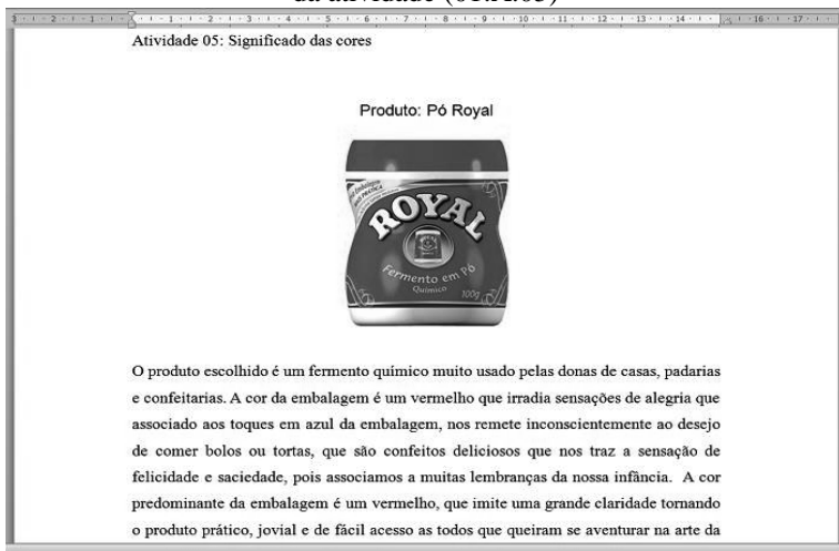
Figura 1 - Apresentação de exclusivamente um exemplo no contexto da atividade (01.A.05)

A análise qualitativo-interpretativa busca enfatizar, no processo de textualização verbo-visual das produções efetivamente realizadas pelos universitários, três dos princípios