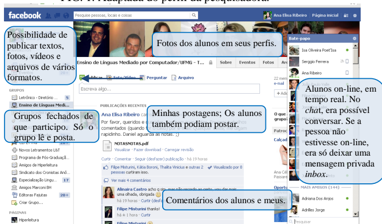
FIG. 1. Adaptada do perfil da pesquisadora.

Todos os alunos responderam ao chamado, sendo que alguns ainda não eram usuários frequentes do Facebook. Conforme a Fig. 1, a rede social mais famosa do mundo oferecia todas as funcionalidades que considerávamos necessárias e interessantes para o andamento do curso: