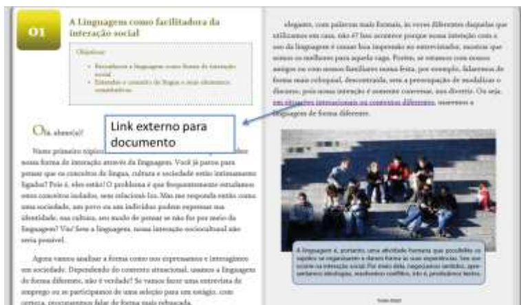
Figura 4. Webaula de Português Instrumental no AVA com a interface de e-book interativo

Como se vê pela descrição do processo de escrita, a webaula reúne vários sujeitos-autores para que a produção desse gênero se concretize. Tudo isso o torna um gênero de escrita colaborativa e com características muito peculiares de produção. Estruturamos um quadro síntese do processo de escrita. Nele descrevemos os sujeitos envolvidos e o papel que exercem na produção.