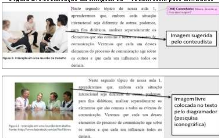
Figura 2. Modificação na imagem da webaula feita pelo ilustrador

A seguir, encontra-se um exemplo de negociação de sentido em que podemos distinguir todos os sujeitos-autores envolvidos no processo de escrita da webaula: