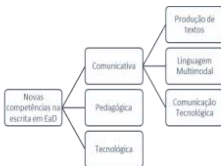
Figura 1. Competências Docentes em EaD estabelecidas por Asinsten (2007)

No que se refere à competência na produção de textos, Asinsten a caracteriza como a capacidade para a) produzir textos dialógicos, abertos à reflexão, à dúvida, ao pensamento crítico; b) produzir textos amenos, fluídos, que envolvam o autor e o leitor; c) produzir períodos claros, taxativos e sintéticos; d) estruturar e organizar adequadamente a informação; e) utilizar os recursos visuais disponíveis (tipografia, formatos de parágrafo, quadros, barras, etc.); f) produzir textos adequados ao gênero. Já sobre a competência comunicativa com recursos multimodais, o autor explica que se trata da “interpretação e produção de mensagens” utilizando-se recursos não verbais nem escritos. Como exemplo dessa competência, aponta as capacidades de selecionar imagens adequadas para os propósitos do texto; de produzir ou manipular imagens; de integrar mensagens de diversos sistemas de códigos em linguagem multimodal; de adequar mensagens audiovisuais às características de diversos suportes, etc. Finalmente a competência em comunicação utilizando as novas tecnologias seria aquela que o sujeito-autor faz quando se mostra letrado digitalmente 2 , melhor ainda, quando utiliza os gêneros que pertencem ao contexto de uma webaula de forma eficiente.