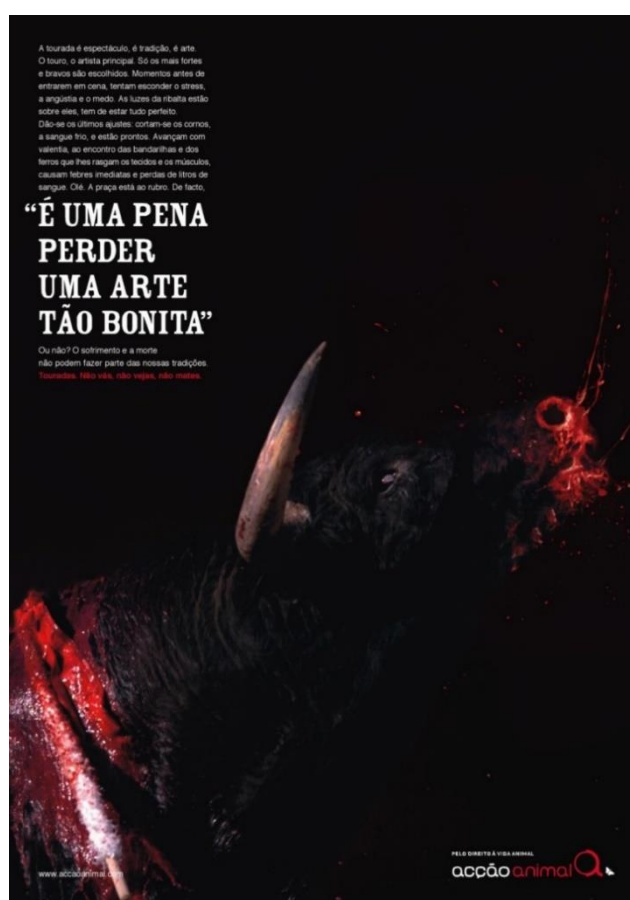
Figura 2 – Publicidade contra as touradas

O primeiro texto analisado faz parte de uma campanha de sensibilização pelo boicote às corridas de touros em Portugal, desencadeada pela Acção Animal – organização portuguesa que propõe a “abolição das relações de aproveitamento e exploração dos animais, por parte dos humanos, e a criação duma consciência de que ambas as espécies possuem os mesmos direitos, podendo coexistir estabelecendo relações harmoniosas, fundadas no mutualismo”. (ACÇÃO ANIMAL, 2019). A campanha ora em foco, veiculada em 2008, foi intitulada “Touradas. Não vás, não vejas, não mates”.