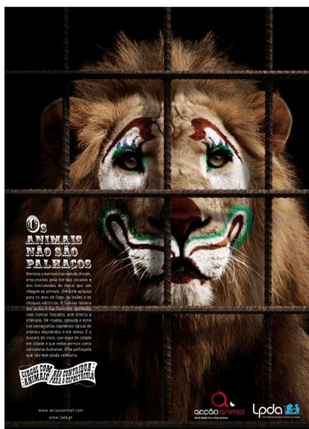
Figura 3 – Publicidade contra a exploração de animais em circos