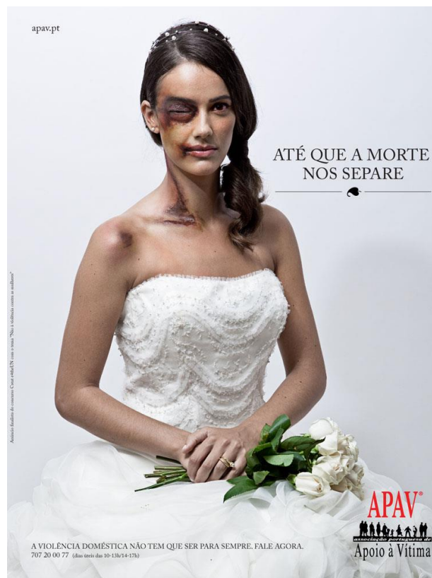
Figura 4 – Publicidade contra a violência doméstica

Fonte: APAV – Campanha em alusão ao Dia Internacional pela Eliminação da Violência Contra as Mulheres (2012)