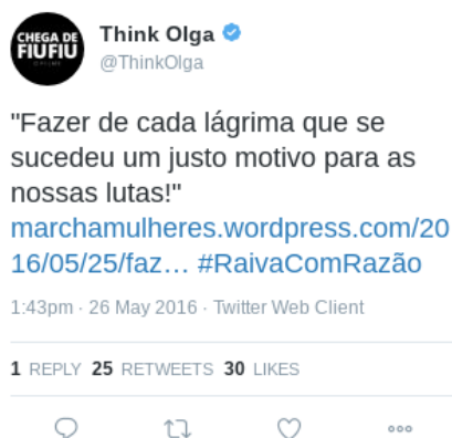
Figura 5 – Texto (4)