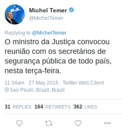
Figura 13 – Texto (12)