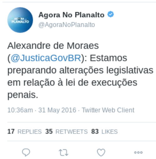
Figura 24 – Texto (23)