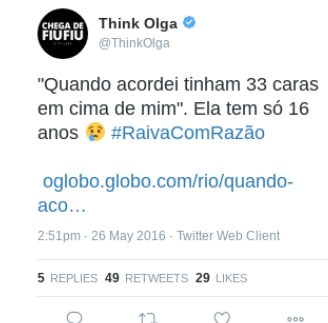
Figura 3 – Texto (2)