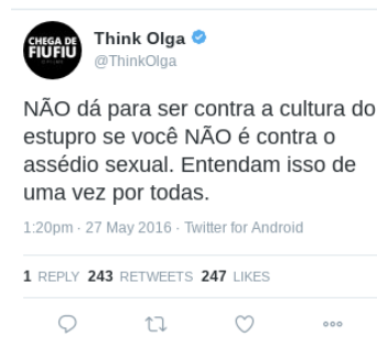
Figura 10 – Texto (9)