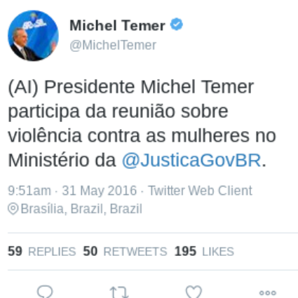
Figura 18 – Texto (17)