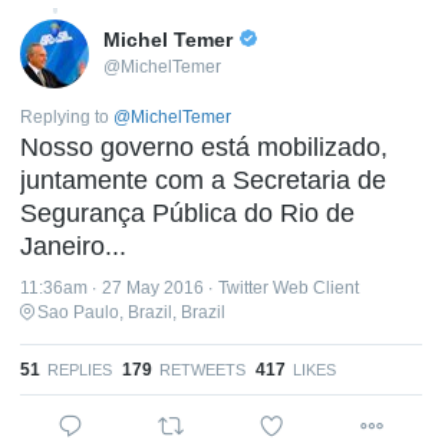
Figura 15 – Texto (14)