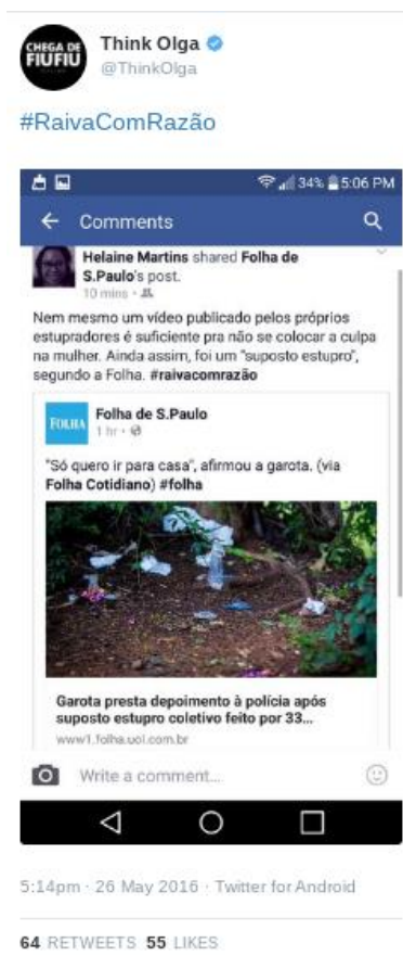
Figura 4 – Texto (3)