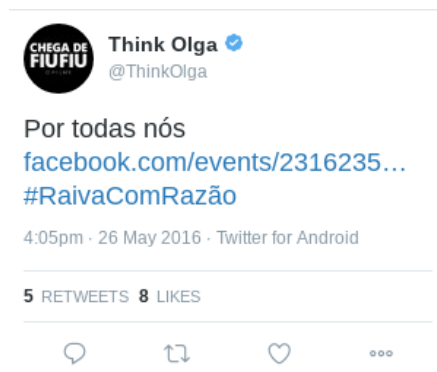
Figura 9 – Texto (8)