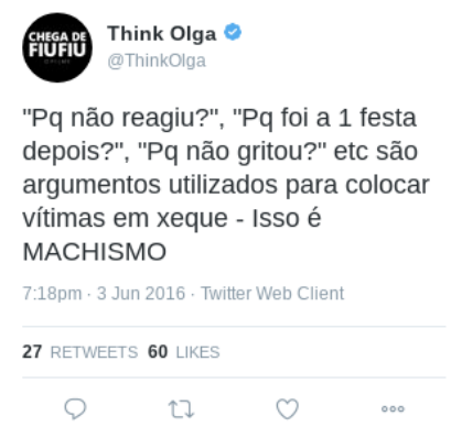
Figura 6 – Texto (5)