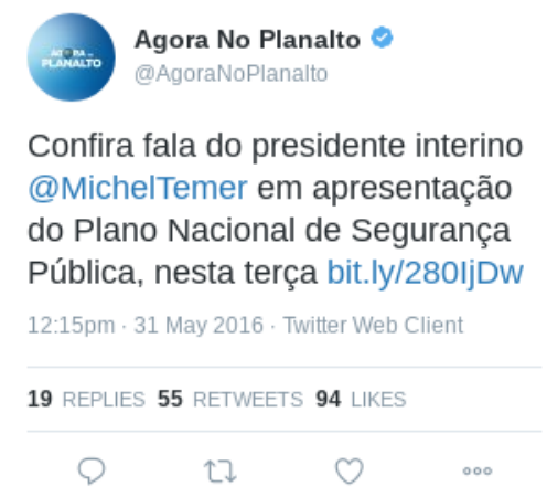
Figura 22 – Texto (21)