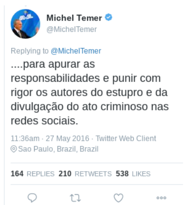
Figura 16 – Texto (15)