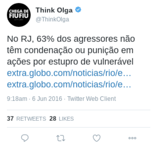
Figura 7 – Texto (6)