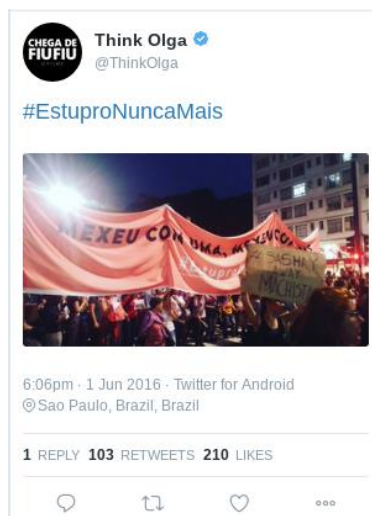
Figura 11 – Texto (10)