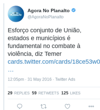
Figura 21 – Texto (20)