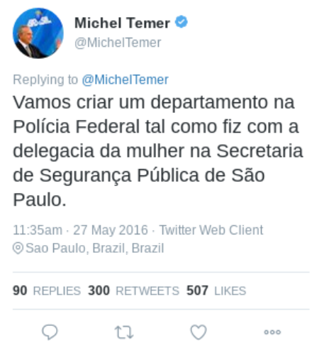
Figura 17 – Texto (16)