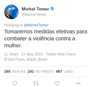
Figura 14 –Texto (13)