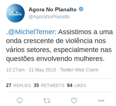
Figura 20 – Texto (19)