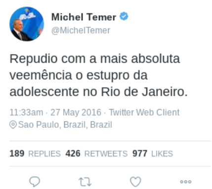
Figura 12 – Texto (11)