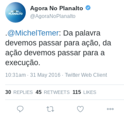
Figura 23 – Texto (22)