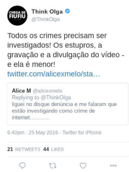
Figura 2 – Texto (1)