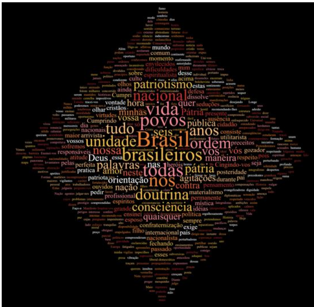
Figura 1 - Nuvem de palavras sobre o Manifesto de maio