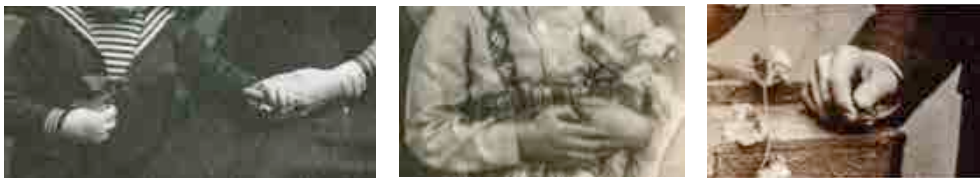
Imagem 2: Detalhes de fotografias vernaculares anônimas/(Coleção: Fotografias Órfãs/ Acervo Fabiana Bruno)

Tendo me lançado, antes de tudo à condição de “um não-saber” e às evidências do ver outros empreendimentos nos reclamam. Os desafios sobre como descrevê-las e etnografá-las visualmente encontram-se na contramão de uma representação. Tento ver. Para tanto, seleciono, corto, destaco, reenquadro. Inclino-me a destinar as imagens a um lugar de experiência, sensações e emoções.