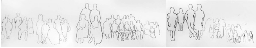
Imagem 3: Desenhos livres de contornos feitos a partir de um conjunto de fotografias anônimas

As fotografias-órfãs reclamariam um outro lugar de memória e uma outra história fotográfica vernacular das famílias, quando recolhidas de espaços sociais “marginais” como mercados de pulgas, feiras de usados, lixeiras de reciclado etc.?