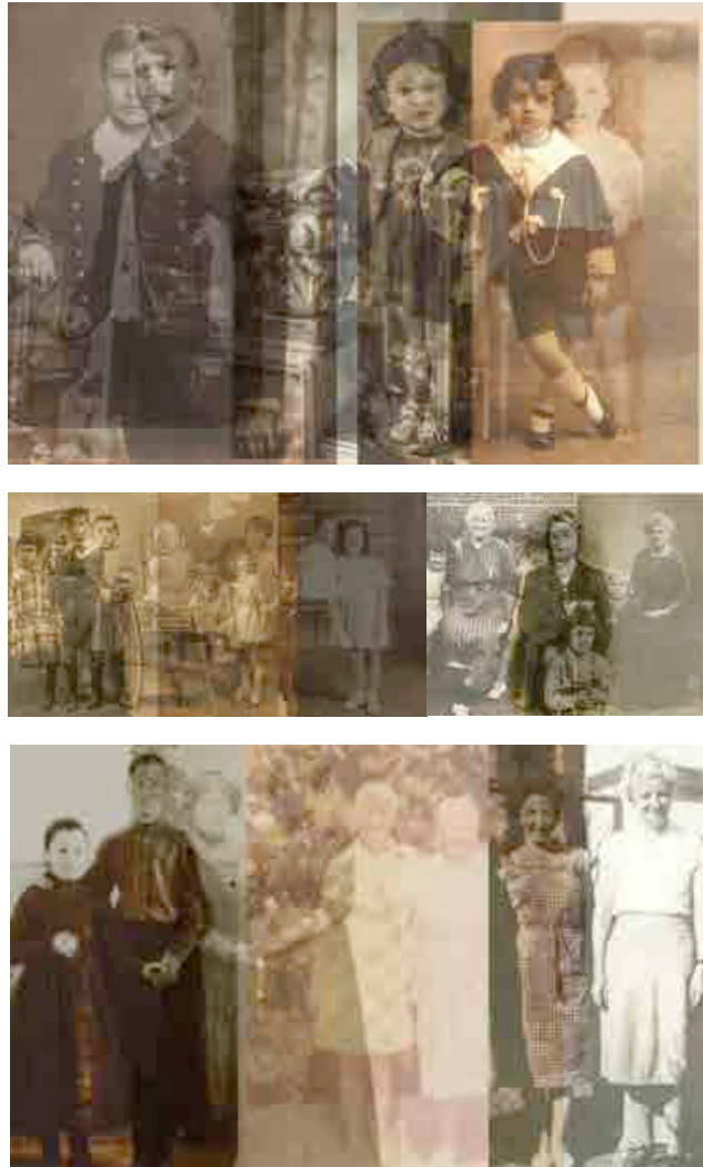
Imagens 4, 5, 6 e 7: Fotografias anônimas colocadas em relação através das sobreposições de seus quadros.

Por correspondências ou analogias, dispostas num conjunto, as imagens reforçam o sintoma de gestos que atravessam as muitas imagens de família. Como se estivéssemos em um longo filme que projeta excessivos quadros por segundo , é assim a experiência de olhar fotografias órfãs e tentar encontrar relações entre elas e nós. Diante delas estamos escrevendo a nossa própria história, aquela que já vivemos com nossas fotografias, mas também aquelas que gostaríamos de ter vivenciado a partir de cenas anônimas que encontramos.