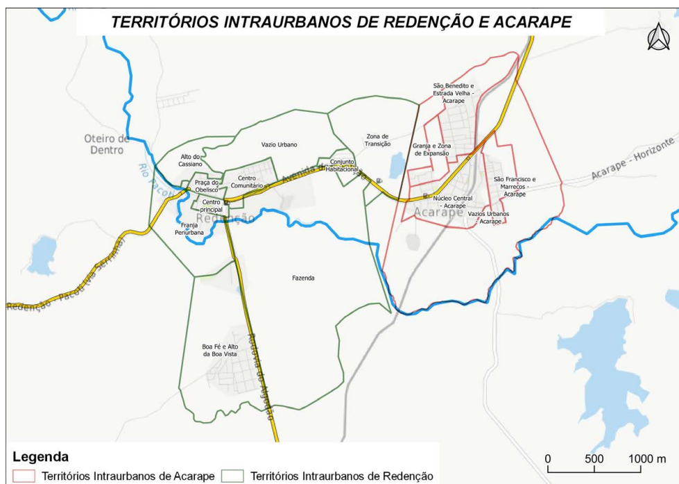
Figura 2 – Territórios intraurbanos de Redenção e de Acarape Fonte: IBGE (2010); Elaborada por Regina Balbino da Silva.

Redenção estrutura-se, como indica a Figura 2, em: (i) duas centralidades, Centro Principal e Praça do Obelisco; (ii) dois bairros agregados, Centro Comunitário e Conjunto Habitacional; (iii) duas grandes periferias: ao sul, Boa Fé/PROURB e Alto da Boa Vista; ao norte, Alto do Cassiano; (iv) vazios urbanos, uma área de transição e duas áreas periurbanas, cabendo destacar a Franja Periurbana e a Fazenda. Como é possível observar, as centralidades concentram equipamentos urbanos privados e públicos. Em Acarape, como indica a Figura 2, a estrutura urbana apresenta: (i) uma ampla porção de vazios urbanos, um bairro de transição e uma área de expansão; (ii) um eixo central, que se apresenta mais como um vetor de estabilização e atração comercial do que como um centro econômico, político e simbólico bem delimitado material e imaterialmente; (iii) duas periferias, São Benedito/Estrada Velha e São Francisco/Marrecos. A maior parcela dos equipamentos urbanos situa-se ao longo da Rua José Guilherme Costa, rua interna principal da cidade, e da Rodovia CE-060, que juntas delimitam o eixo central.