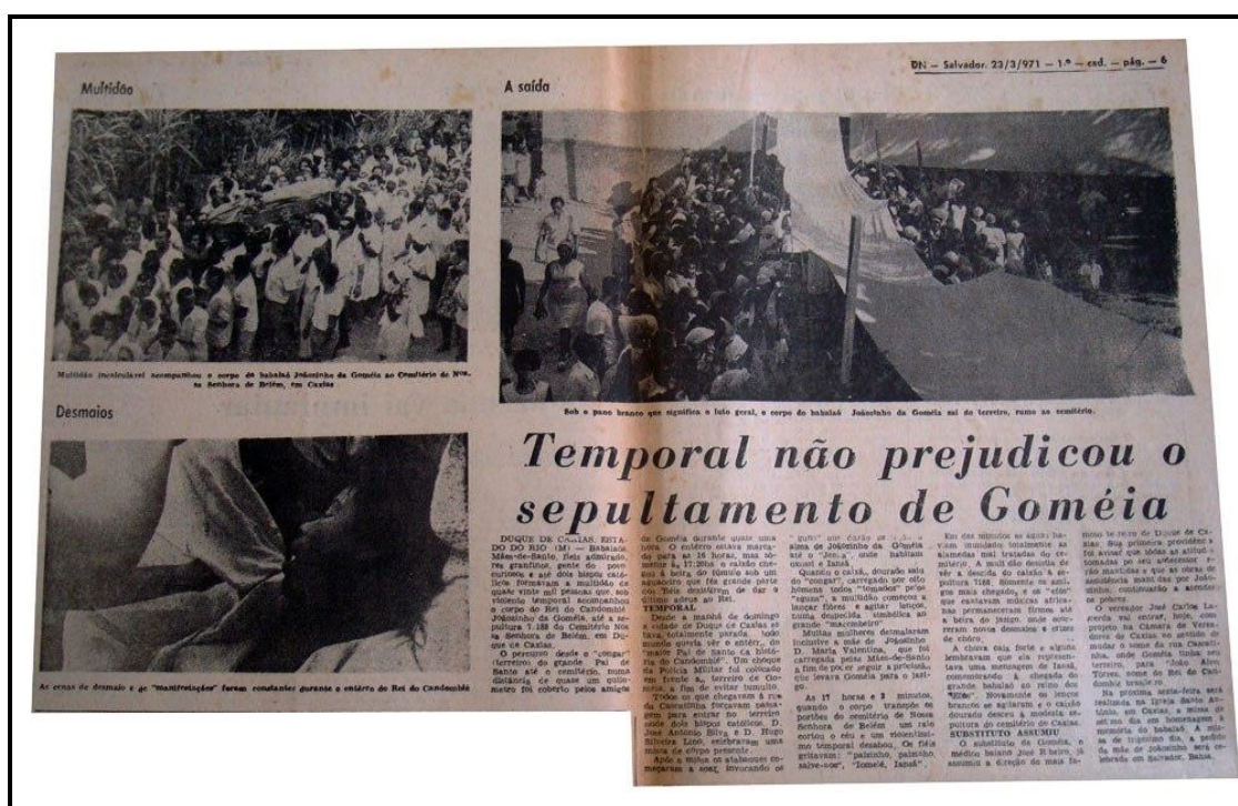
Figura 1: Matéria de 23/03/1971 do Jornal Diário de Notícia sobre o enterro de Joãozinho da Gomeia.