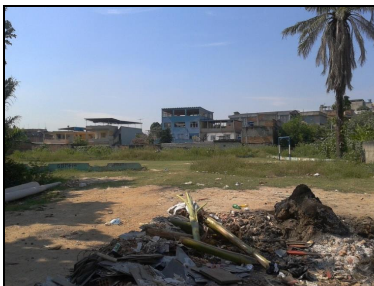
Figura 4: Estado do espaço onde se localizava o Terreiro da Gomeia (Duque de Caxias) em 2012.