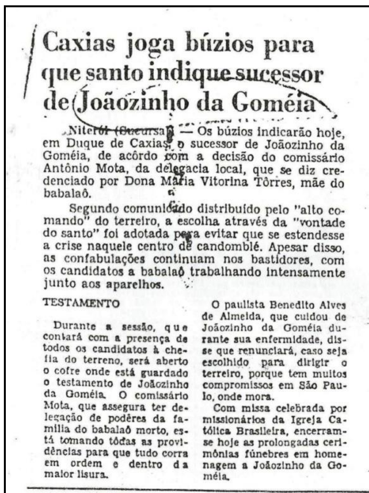
Figura 2: Jornal do Brasil de 29/03/1971 noticiando a abertura do cofre de Joãozinho.