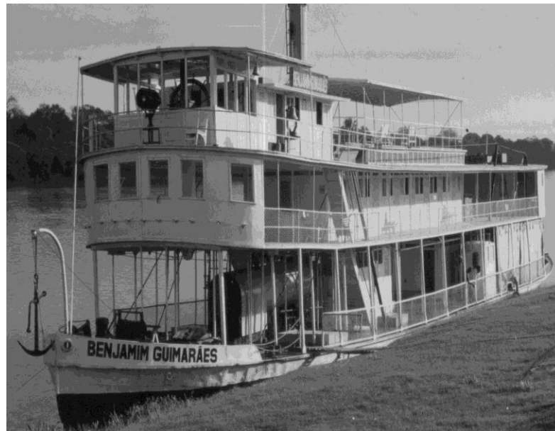
Figura 2: Vapor “Benjamim Guimarães” no porto de Pirapora.