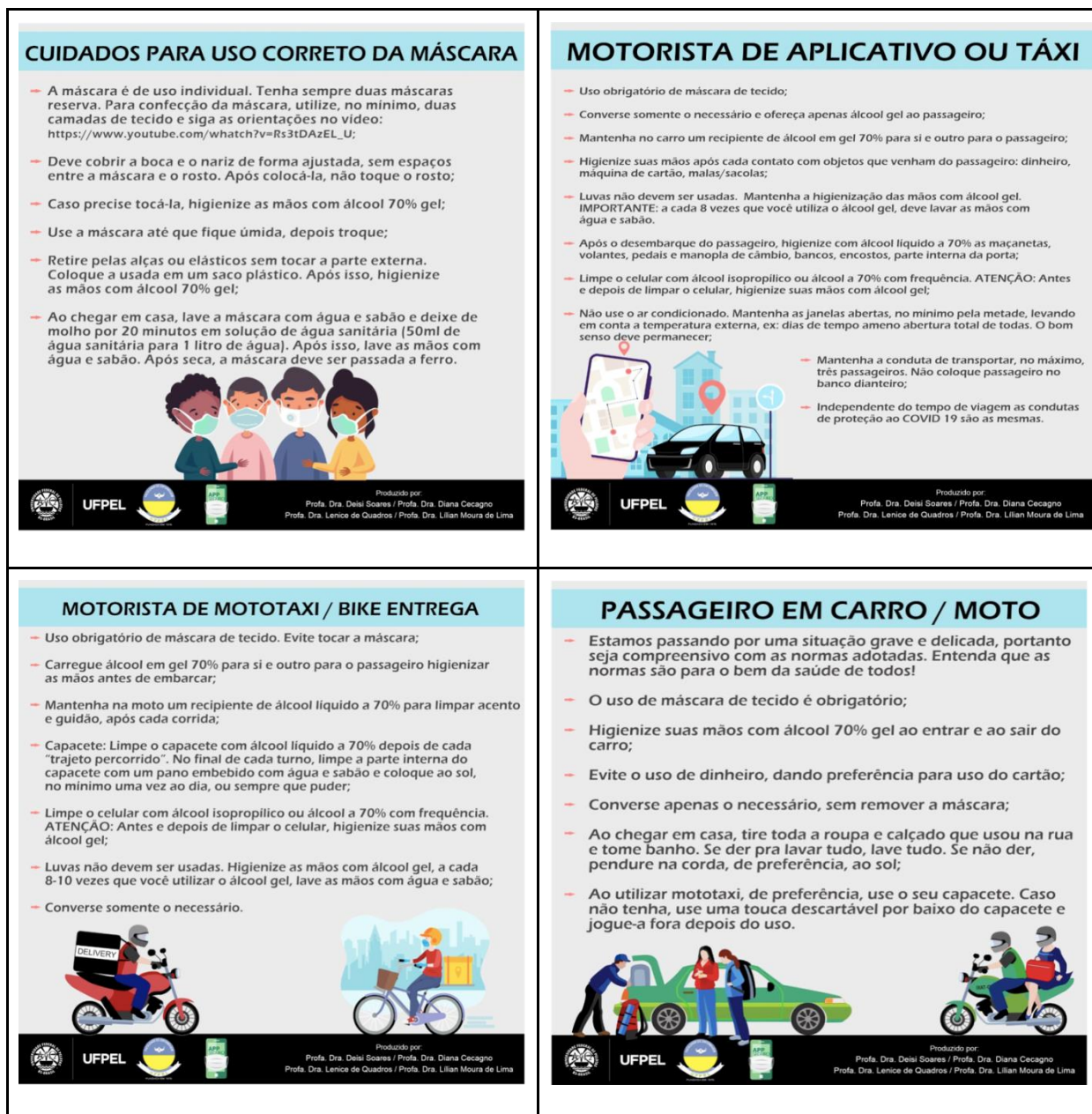
Figura 01: Infográficos com orientações quanto ao uso correto da máscara e cuidados essenciais no contexto da COVID-19 para os trabalhadores do transporte individual de passageiros e entregadores.

estudos sugere a elaboração de projetos construtivos que possam contribuir para a diminuição de doenças e melhor bem-estar do motorista. 17