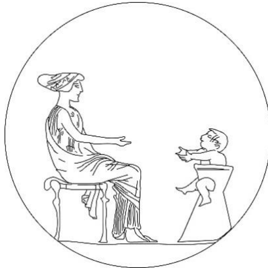
Figura 04: Cálice de figuras vermelhas. Bruxelas, Museu Real, A890. Desenho: Martín Centurión.

representativa. Por outro lado, o cuidado com as crianças e a instrução das meninas nas tarefas domésticas são temas bastante comuns na imagética ática, do qual o cálice de figuras vermelhas do Museu Real de Bruxelas é apenas um exemplo (Figura 04). No medalhão decorativo do vaso, vemos uma figura feminina interagindo com uma criança pequena, que está sentada em uma cadeira alta e estende os braços em sua direção.