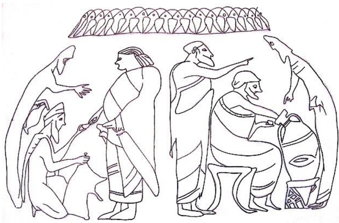
Figura 03: Ânfora de figuras negras. Bruxelas, Museu Real, R279. Desenho face B: Martín Centurión.

Em uma ânfora de figuras negras do Museu Real de Bruxelas, podemos ver nas duas faces, cenas que demonstram figuras femininas e masculinas durante uma atividade de comércio (venda de óleo, de acordo com a descrição de John Beazley 18 ), não sendo possível afirmar se em um espaço interior ou exterior. Em ambas as cenas, a presença feminina parece estar em completa harmonia com o espaço e as demais figuras masculinas. As mulheres têm o corpo robusto, o queixo protuberante, vestem vestes simples, não apresentam marcação de seios e têm o cabelo preso e curto (Figura 03) 19 . A diferença em relação às figuras femininas que aparecem nas cenas de gineceu é perceptível, podendo estar marcando uma distinção de classe social ou idade. Mesmo considerando a mão do pintor e entendendo a diferença de período (as píxides são de um período específico entre 475 – 425 a. C., e a ânfora tem uma datação de 500 – 550 a. C.), ainda assim, podemos supor que se tratassem de mulheres cidadãs, que poderiam estar comprando ou vendendo produtos no mercado.