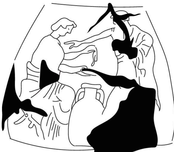
Figura 05: Pélica de figuras negras. Míconos, Museu Arqueológico, 1865. Desenho face A: Martín Centurión.

Em uma pélica de figuras negras do Museu Arqueológico de Míconos, 1865 25 , podemos ver novamente a atuação da mulher no comércio. A cena que decora uma das faces do vaso (Figura 05) é composta por uma figura feminina, sentada em um banco, manipulando objetos com as mãos. À sua frente figura um homem apoiado em uma bengala, que estende um dos braços em direção à mulher. Conforme a descrição de John Beazley no Attic Black-Figure Vase-Painters (1956), o tema da cena é a venda de óleo, o que corroboramos pela postura registrada nas duas figuras: a mulher parece estar de fato manipulando um produto com ambas as mãos, enquanto o homem dirige-se a ela. Podemos sugerir que a cena capta o momento de uma transação comercial, em que a figura feminina manipula o produto a ser oferecido ao cliente. Nada indica o cenário na decoração da cena, portanto não sabemos se esta é uma cena de interior ou exterior; entretanto, não é isso o que consideramos importante: a particularidade desse vaso é aquela de demonstrar a ocupação feminina em uma atividade comercial.