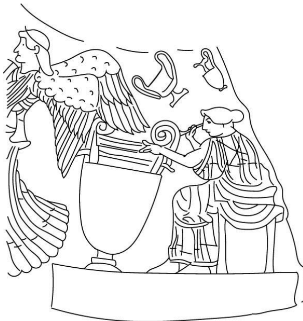
Figura 06: Detalhe da figura feminina manipulando uma grande cratera com volutas na hídria de figuras vermelhas, Milão, Torno, C278. Desenho: Martín Centurión.

Entendemos que a cena representa uma oficina cerâmica, e que as figuras de Atena e das duas Niké servem para confirmar que os ofícios do oleiro e do pintor constituem um saber especializado, e assim os glorificam. Detendo-nos um pouco mais na figura da pintora, podemos perceber que ela se encontra